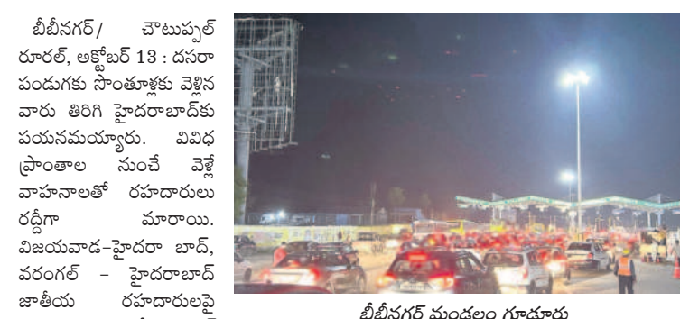
బీబీనగర్ మండలం గూడూరు లో ట్రాఫిక్ వద్ద నిలిచిన వాహనాలు

బీబీనగర్ / చౌటుప్పల్ రూరల్, అక్టోబర్ 13 : దసరా పండుగకు సాంతూళ్ల వెళ్లిన వారు తిరిగి హైదరాబాద్ కు పయనమయ్యారు. వివిధ ప్రాంతాల నుంచే వెళ్ల వాహనాలతో రహదారులు రద్దీగా మారాయి. విజయవాడ-హైదరాబాద్, వరంగల్ - హైదరాబాద్ జాతీయ రహదారులపై ఆదివారం పలుచోట్ల ట్రాఫిక్ సమస్య ఏర్పడింది. యాదాద్రి భువనగిరి జిల్లా చౌటుప్పల్ మండలం పంతుంగిలో ట్రాఫిక్ వద్ద, చౌటుప్పల్ పట్టణంలో వాహనాల రద్దీతో ట్రాఫిక్ అంతరాయం కలిగింది. బీబీనగర్ మండల పరిధిలో గూడూరు లో ట్రాఫిక్ వద్ద గంట పాటు ట్రాఫిక్ జామ్ ఏర్పడింది. రెండు కిలోమీటర్ల మేర వాహనాలు నిలిచిపోయాయి. ఘాస్టాగ్ విధానం అమలులో ఉన్నప్పటికీ ఒక్క సారిగా పరిమితి మించి వచ్చిన వాహనాలతో ఈ సమస్య ఎదురైంది. వాహనాలతో ఈ సమస్య ఏర్పడింది. టోల్ ఫ్రాజా టోల్ ఫ్రాజా వద్ద, చౌటుప్పల్ లైన్లలో పాటు మరెన్ని లైన్లను ఏర్పాటు చేసి వాహనాలను పంపించారు. ట్రాఫిక్ జామ్ తో వాహనదారులు టోల్ ఫ్రాజా వద్ద గంట పాటు ట్రాఫిక్ జామ్ ఏర్పడింది. రెండు కిలోమీటర్ల మేర వాహనాలు నిలిచిపోయాయి. ఘాస్టాగ్ విధానం అమలులో ఉన్నప్పటికీ ఒక్క సారిగా పరిమితి మించి వచ్చిన వాహనాలతో ఈ సమస్య ఎదురైంది.