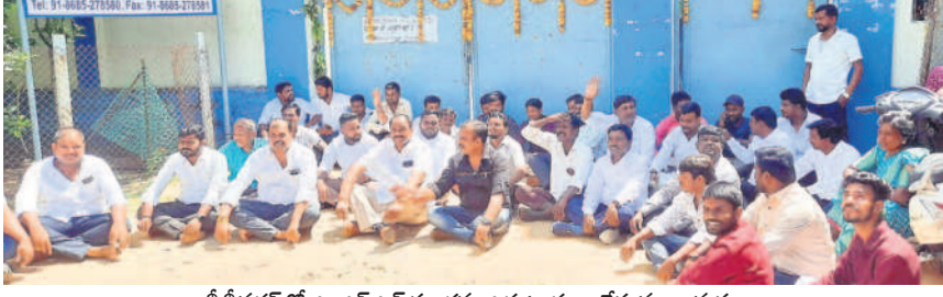
బీబీనగర్ లో ఎంఎస్ఎస్ పరిశ్రమ ఎదుట ధర్మా చేస్తున్న గ్రామస్థులు