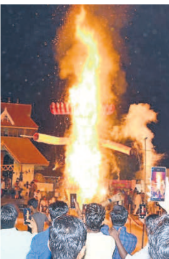
భూదానపోచంపల్లిలో రావణాసుడి దివ్యబొమ్మను దహనం చేస్తున్న గ్రామస్థులు