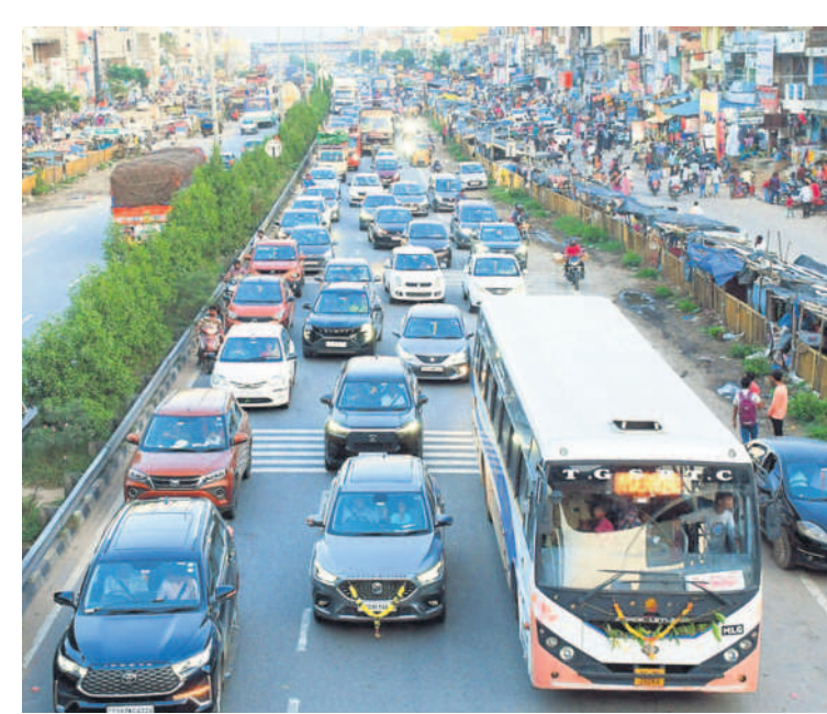
చౌటుప్పల్ పట్టణంలో బారులుదీరిన వాహనాలు