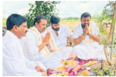
అధ్యక్షులు (ఎం): తన వ్యవసాయ క్షేత్రంలో జమీన్దార్లకు వద్ద పుణ్యం చేస్తున్న మాజీ ఎమ్మెల్యే బూడిద బిక్షుమయ్యగారికి