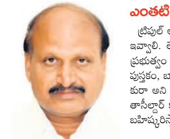
-అంతటి పోరాటాల కై నా సిద్ధమే..

ట్రిపుల్ ఆర్ అలైన్మెంట్ మార్చాలి. లేదా భూమికి బదులు భూమి ఇవ్వాలి. లేదంటే బహిరంగ మార్కెట్ ధర కట్టించాలి. అంతేగాని ప్రభుత్వం 3జీ బహిరంగ నోటీస్ జారీ చేసి రైతుల పట్టాదారు పాసు పుస్తకం, బ్యాంక్ అకౌంట్, పాస్ కార్డు, ఆధార్ కార్డు జిరాఫ్స్ తీసుకురా ఆని చెప్పడం సర్కారు కాదు. దీనిని పూర్తిగా వ్యతిరేకిస్తున్నాం. తాస్లీల్ కార్యాలయం నిర్వహించే సమావేశాలను కూడా పూర్తిగా బహిష్కరిస్తాం. ఎంతటి పోరాటాలకైనా సిద్ధమే.