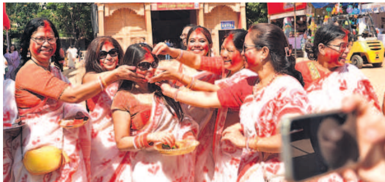
సికింద్రాబాద్ కిన్ హైమవతి అవతరణలో భాగ్య సంస్కృతి సాంగ్ బెంగాలి అధ్యక్షులతో అమ్మవారికి బెంగాలిలు ప్రత్యేక పూజలు నిర్వహించారు. అనంతరం మహిళలు పెద్ద సంఖ్యలో పాల్గొని ఒకరికి ఒకరు కుంకుమ తిలకం దిద్దుకున్నారు. అలాగే డ్యాన్స్ చేసి మిఠాయిలు తినించుకున్నారు.