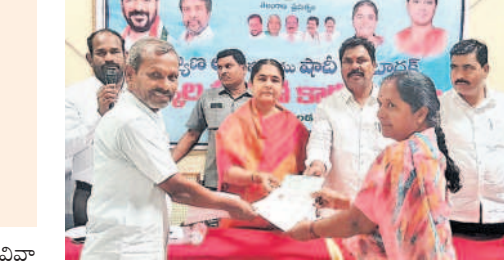
నర్సాపూర్లో కల్యాణలక్ష్య చెక్కుల అందజేపును ఎమ్మెల్యే