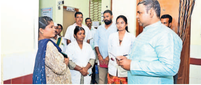
పాఠశాల పీహెచ్సీలో కలెక్టర్ తనిఖీ

పాపన్నపేట, అక్టోబర్ 11: రోగులకు శుక్రవారం తనిఖీ చేశారు. దమాజానకు వచ్చి మెరుగైన వైద్యసేవల అందించాలని కలెక్టర్ రోగులకు సీజనల్ వ్యాధులపై అవగాహన రాహుల్ రాజ్ ఆడియోలోని కల్పించాలని, వ్యక్తిగత, పరిసరాల శుభ్రతపై పాఠశాల పీహెచ్సీ కేంద్రాన్ని ఆయన వివరించాలని సూచించారు.