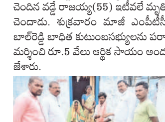
రామాయంపేట మండలంలోని గొల్లూరిలో టీవీ ఉద్యోగం పొందిన రొయ్యల రాజకు సన్మానం చేస్తున్న రామన్నలు