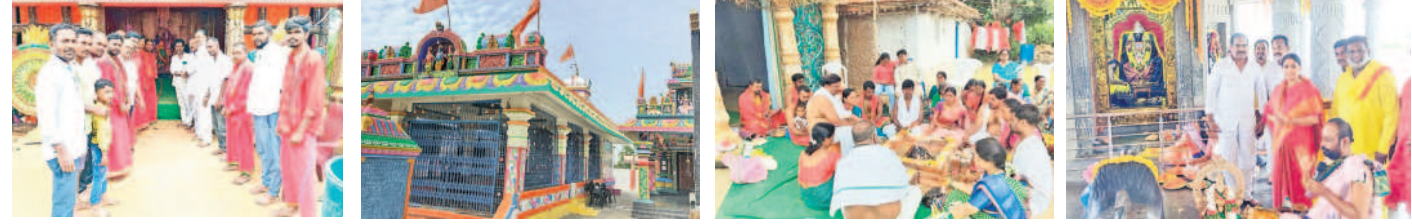
నిజాంపేటలో.. మెడక్ మండలంలో.. చిన్నశంకరంపేట, చిలిపిచెడలో చేగుంటలో పూజలు చేస్తున్న భక్తులు