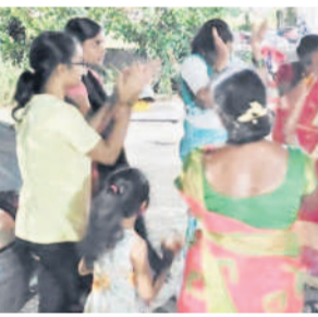
మోర్లాడ్, కమ్మర్పల్లి మండలాల్లో బతుకమ్మ వేడుకలు కొనసాగుతున్నాయి. ఈ ప్రాంతంలో కొత్తలు కోసే పనిలో నిమగ్నమయ్యారు.

రెంజల్, అక్టోబర్ 11 : మండలంలోని కందకర్తి, నీలా, బోగూరు ఇతర గ్రామాల్లో సాయా పంట కోతలు జోరుగా సాగుతున్నాయి. పంట చేతికొచ్చిన సమయంలో వాతవరణంలో మార్పుతో అందోళన చెందుతున్న తెలుగు సాయాలను యాంత్రిక సహాయంతో కోతలు కోసే పనిలో నిమగ్నమయ్యారు.