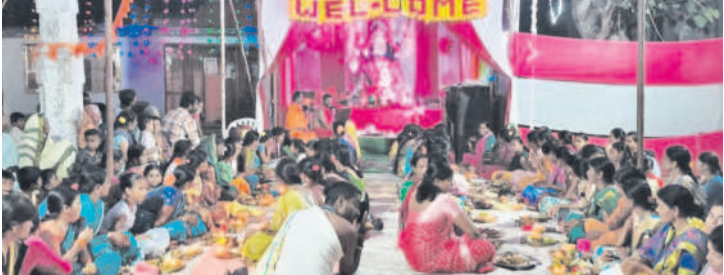
పాతంగల్ మండలంలోని కలెక్టర్ కుటుంబాధ్యక్షుల పాల్గొన్న మహిళలు

సుభాషినగర్/ చంద్రగిరి/ ధర్మలి/ ఇంద్రావతి/ కోటగిరి (పాతంగల్) / పాతంగల్/మోర్లాడ్, భీమగల్, ఆర్బూర్, బోధన్ రూరల్, అక్టోబర్ 11 : జిల్లావ్యాప్తంగా దేవీ సవారాలోత్సవాలు కొనసాగుతున్నాయి. ఉత్సాహాల్లో భాగంగా తొమ్మిదో రోజు అమ్మవారిని మహిషాసురమర్ధిని అమ్మవారి రూపంలో అలంకరించారు. ఈ సందర్భంగా మండలం వద్ద హోమాలు, కుంకుమార్చులు, ప్రత్యేక పూజలు నిర్వహించారు. చంద్రగిరి మండలకేంద్రంలోని మండలం వద్ద పూజలు, భజన కార్యక్రమాలు చేపట్టారు. జిల్లాకేంద్రంలోని అమ్మవారి ఆలయాల్లో దుర్గా సప్తశతీ పారాయణాలు, అన్నప్రసాద కార్యక్రమాలు నిర్వహించారు. మహర్నవమి సందర్భంగా పలు మండలాల వద్ద వాహనాలకు పూజలు చేశారు. శనివారం జగన్మాతను రాజాజిశ్వరీగా అలంకరించి దసరా, వేడుకలు నిర్వహించనున్నారు. 13వ దుర్గామాత నిమజ్జితోత్సవం ఉంటుందిని మండలం నిర్వాహకులు తెలిపారు. ఇంద్రావతి మండలం