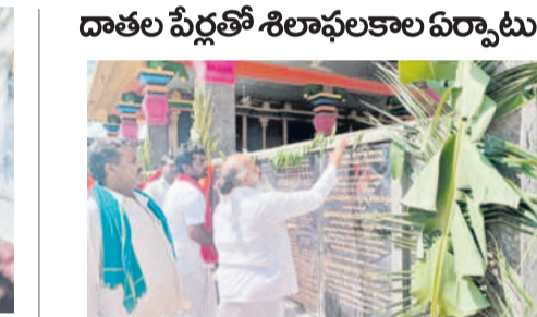
శిలాఫలకాలను ప్రారంభిస్తున్న మంగిరాములు మహారాజ్