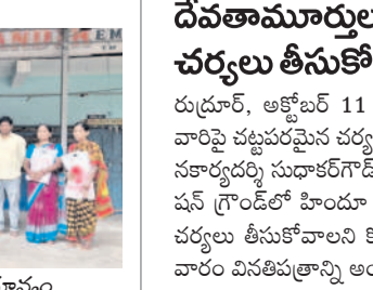
దుస్తులు అందజేస్తున్న పాఠశాల యాజమాన్యం

రుద్రూర్, అక్టోబర్ 11 : హిందూ దేవతామూర్తులపై దాడిచేసిన వారిపై చర్యలపై చర్యలు తీసుకోవాలని డి.పి.ఎం. డి.పి.సి జిల్లా ప్రధాన కార్యదర్శి సుధాకర్ గాంధీ అన్నారు. భాగ్యనగరంలో నాంపల్లి ఎన్.టి.ఎస్ గ్రాండ్ హిందూ దేవతామూర్తుల ద్వారా చేసిన వారిపై చర్యలు తీసుకోవాలని కోరుతూ రుద్రూర్ ఎస్పీ సాయుధుడు శుక్రవారం విసేతపత్రాన్ని అందజేశారు.