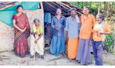
రావిరాలలో దెబ్బతిన్న నష్టపరిహారం అందని బాధితులు