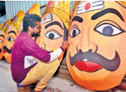
రావణ ప్రతిమకు తుదిమెరుగులు దిద్దుతున్న కళాకారుడు