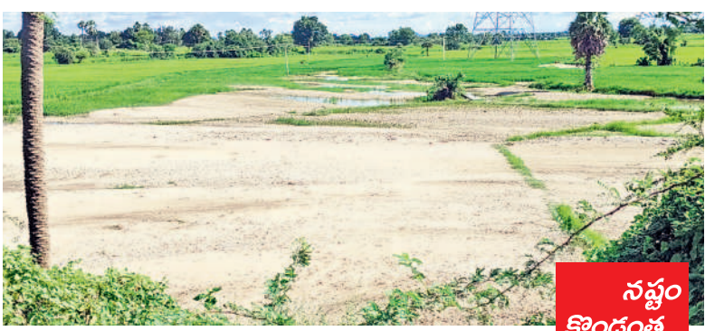
రావిరాలలోని కోపటికుంటు చెరువు కట్ట తెగి పొలాల్లో వేసిన ఇసుక మేటలు