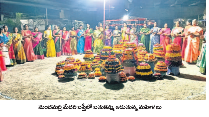
మండలమేదరి బస్తీలో బతుకమ్మ ఆడుతున్న మహిళలు

మంచిర్యాల, ఆసిఫాబాద్ జిల్లాల్లో సద్దుల బతుకమ్మ సంబరాలు అంబరాన్నంటాయి. తీర్థోత్సవాలతో బతుకమ్మలను అందంగా పేర్చిన ఆడబిడ్డలు, సాంఘిక ప్రధాన కూడళ్లలో పెట్టి ఆడిపాడారు. డిజైన్ పాటలపై స్వత్యాలను చేస్తూ హాలోర్లించారు. కోలాటాటో సందడి చేశారు. అనంతరం బతుకమ్మలను వాగులు, చెరువుల్లో నిమజ్జనం చేశారు. ఒకరికొకరు వాయిదాలు ఇచ్చిపుచ్చుకున్నారు. సత్తులు పంచుకొని తిన్నారు. పలుచోట్ల ప్రజాప్రతినిధులు పాల్గొని తిలకించారు. ఆయనోట్లు పోలీసులు బంధోబ్బు ఏర్పాటు చేశారు. బెజ్జూర్ : కుటుంబ వాగులో బతుకమ్మలను నిమజ్జనం చేసేందుకు వెళ్లారు.