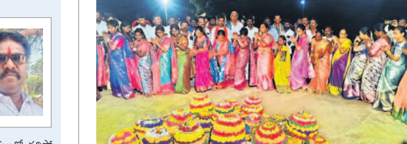
గుండాలలో సద్దుల బతుకమ్మ ఆడుతున్న గ్రామస్థులు

యాదాద్రి భువనగిరి జిల్లాలో సుమారు 5 వేల ఆటోలు నడుస్తున్నాయి. ముఖ్యంగా గ్రామీణ ప్రాంతాల నుంచి పట్టణ ప్రాంతాలకు నిత్యం వందలాది ఆటోలు వస్తూ పోతూ ఉంటాయి. తద్వారా అనేక కుటుంబాలకు ఉపాధి లభిస్తున్నది. గతంలో నిత్యం ఖర్చులన్నీ పోగా నాలుగైదు వందల వేలకే వచ్చేది. కుటుంబ పోషణకు ఇబ్బంది ఉండేది కాదు. ప్రీ బస్సు వచ్చే ఆటోలకు ఆదరణ తగ్గింది. గతంలో వచ్చిన డబ్బులో సగం గిరాకీ కూడా ఉండడం లేదు. రోజుకు రూ.200 కూడా మిగలడం లేదని డ్రైవర్లు వాపోతున్నారు. బండి కిక్కిలూ కూడా చెల్లించలేకపోతున్నామని తీవ్ర ఆవేదన వ్యక్తం చేస్తున్నారు. కొందరు అప్పులు తెచ్చి చెల్లిస్తుండగా, మైక్రోడరు కిక్కిలూ కట్టలేక చేతులెత్తిస్తున్నారు. డాంట్ ఫ్యామిలీ వ్యాఖ్య బండ్లను గుంజుకుపోతున్న పుటలను కనిపిస్తున్నాయి. ఇటీవల అప్పుల బాధ తాళలేక భూదాన్ పోషం పల్లి మండలంలో ఓ ఆటో డ్రైవర్ అత్యుపాధ్యక్షుడు పాల్గొన్నారు. ఇప్పటికైనా ప్రభుత్వం స్పందించి జీవన భృతి అందించాలని ఆటో కార్యకర్తలకు డిమాండ్ చేస్తున్నారు.