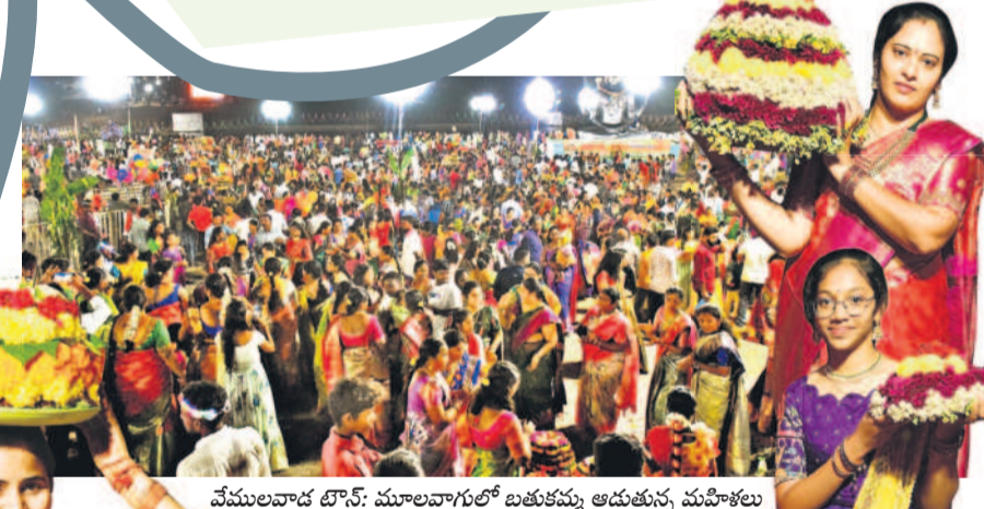
వేములవాడ టౌన్: మూలవాగులో బతుకమ్మ ఆడుతున్న మహిళలు

ట్రిజెరి కార్యాలయాల్లో ఒక బిల్ పాస్ కావాలంటే ప్రతి పనికి ఓ రేటు కడుతున్నారన్న ఆరోపణలున్నాయి. ఉమ్మడి జిల్లాలోని పలు సబ్ ట్రిజెరి కార్యాలయాల్లో మాత్రం అవినీతి పెంపొందించుకునే పలువురు ఉద్యోగులే చెబుతున్నారు. పంచాయతీ కార్యదర్శి నెలనెలా సమర్పించే బిల్లులు నుంచి వేముల ఇతర అన్ని పనులకు ముక్కుపిండి మామూళ్ల వసూలు చేస్తున్నారన్న ఆరోపణలు వెల్లువెత్తుతున్నాయి. అడిగిన మొత్తం ఇవ్వకపోతే అనేక కొర్రలు పెట్టి, ముప్పు తీసుకుంటున్నారు. కాగా, ప్రస్తుతం నిఘా వర్గాల విచారణలో అనేక అంశాలు వెలుగులోకి వస్తున్నట్లు తెలుస్తున్నది. కొన్ని ట్రిజెరి కార్యాలయాల్లో పై అధికారులు బాగానే ఉన్నా.. తింద నుంచి ఫైల్ కడపాలంటే ముందుగా వారికి అమ్మాయిల ముఖ్యులపై పనిచేసి, అప్పుడే ఆ ఫైల్ ముందుకెళ్లించి చెప్పినట్లు తెలుస్తున్నది. అంతేకాదు, వేములవాడలో ట్రిజెరి కార్యాలయంలో పనిచేసే ఇద్దరు ఉద్యోగుల తీరుపై అనేక ఆధారాలు నిఘావర్గాలకు చూపించినట్లు తెలుస్తున్నది. లంచాలు వసూలు చేయడంలో వారికి వారి సాటిని, ఒక వేళ అడిగింది ఇవ్వకపోతే నెలల తరబడి తిరగాల్సి వస్తుందని, అందుకే అల్లిక పరిస్థితులు సహకరించినా సహకరించక పోయినా.. మామూళ్ల ఇవ్వక తప్పలేదని ఆవేదన వ్యక్తం చేసినట్లు సమాచారం. లంచావశాలను సంఘ నాయకులను కూడా వదిలి పెట్టడం లేదని ఓ సమాహాని చెందిన నాయకుడు తన ఆవేదన వ్యక్తం చేశారు. ముడుపులు ముట్టుకుంటూ ఏ పని కావడం లేదని ఓ రెవెన్యూ అధికారి తన బాధను వెల్లడించారు.