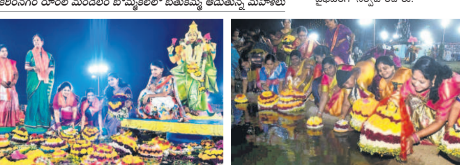
కరీంనగర్ రూరల్ మండలం బొమ్మకల్లో..