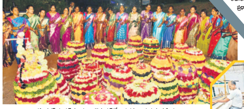
కరీంనగర్ రూరల్ మండలం బొమ్మకల్లో బతుకమ్మ ఆడుతున్న మహిళలు

ఆడబిడ్డల అతిపెద్ద పండుగైన బతుకమ్మ వేడుకలపై రాష్ట్ర ప్రభుత్వం అంతులేని నిర్లక్ష్యం చూపుతున్నది. గత బీఆర్ఎస్ ప్రభుత్వం ఏడాది బతుకమ్మ ఏర్పాటు కోసం ప్రతి జిల్లాకు ₹10 లక్షలు కేటాయించినా.. ఈసారి మాత్రం అణాపైసా కేటాయింపలేదు. దీంతో పంచాయతీలు, మున్సిపాలిటీల్లో అధికారులు ఏర్పాట్లపై చేతులెత్తారు. మరోవైపు 'బతుకమ్మ కార్యక్రమం' నా తెలంగాణ అకాడమీలో, అప్పలకు ఈసారి రెండేసి వేల చొప్పున 'అన్న' సీఎం రేవంత్ రెడ్డి మాట.. ఆరణ్యకు నోచుకోక పోవడంపై మహిళలు అగ్రహం వ్యక్తం చేస్తున్నారు. ఈ ప్రభుత్వం తమను చిన్న చూపు చూస్తున్నది. మాటలే తప్ప చేతలేవంటూ మండిపాటు.