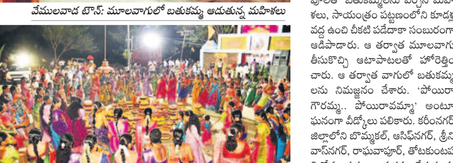
వేములవాడ టౌన్: మూలవాగులో బతుకమ్మ ఆడుతున్న మహిళలు

వేములవాడ టౌన్/ కరీంనగర్ రూరల్ /కొత్తపల్లి, అక్టోబర్ 8 : రాజ్యస్థాయి క్రైతం పులలించిపోయింది. మహిళల బతుకమ్మ ఆటాపాటలతో మార్చాగింది. ఆనవాయితీ ప్రకారం ఏడు రోజులకు నిర్వహించిన సర్దుల బతుకమ్మ సంబరం అంటూన్నట్లంది. ఆడబిడ్డల సందడితో మూలవాగు మురిసిపోయింది. మంగళవారం ఉదయం తీరకృష్ణ పూలతో బతుకమ్మలను పేర్చిన మహిళలు, సాయంత్రం పట్టణంలోని కూడళ్ల వద్ద ఉంచి చీకటి పడేదాకా సంబరంగా ఆడిపాడారు. ఆ తర్వాత మూలవాగు తీసుకొచ్చి ఆటాపాటలతో హోరెత్తించారు. ఆ తర్వాత వారులో బతుకమ్మ లాడు, సాయంత్రం పట్టణంలోని కూడళ్ల వద్ద ఉంచి చీకటి పడేదాకా సంబరంగా ఆడిపాడారు. ఆ తర్వాత మూలవాగు తీసుకొచ్చి ఆటాపాటలతో హోరెత్తించారు. ఆ తర్వాత వారులో బతుకమ్మ లాడు, సాయంత్రం పట్టణంలోని కూడళ్ల వద్ద ఉంచి చీకటి పడేదాకా సంబరంగా ఆడిపాడారు. ఆ తర్వాత మూలవాగు తీసుకొచ్చి ఆటాపాటలతో హోరెత్తించారు.