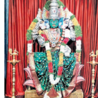
ఉప్పల్ వాసవీ ఆలయంలో గాయత్రీదేవి అలంకారంలో అమ్మవారు