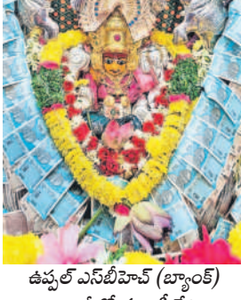
ఉప్పల్ ఎన్.వి.హిల్స్ (బ్యాంక్) కాలనీలో గణపతి దేవి అలంకారంలో దుర్గమ్మ