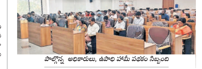
పాల్గొన్న అధికారులు, ఉపాధి హామీ పథకం సీబీఎం

మేడ్చల్, అక్టోబర్ 8 : రాష్ట్ర సంవత్సరంలో ఉపాధి హామీ పథకం లక్ష్యాన్ని పూర్తి చేసేందుకు అధికారులు కృషి చేయాలని అడిషనల్ కలెక్టర్ రాధికా గుప్తా అధికారులను ఆదేశించారు. మంగళవారం గ్రామాల ఉపాధి హామీ పథకం సీబీఎం డి.కె.ఆర్.అవగాహన సదస్సును కలెక్టరేట్ లోని ప్రజావాణి సమావేశ మందిరంలో నిర్వహించారు. ఈ సందర్భంగా ఆమె మాట్లాడుతూ ఉపాధి హామీ పథకంలో అన్ని రకాల పనులను పూర్తి చేసి, కూలీలకు ఉపాధి కల్పించాలని ఎంపీ డి.ఎం. ఎం.ఎం. పంచాయతీ కార్యదర్శులకు సూచించారు. సర్కర్ లో మొత్తం పెంపకం, నీటి నిల్వ సౌకర్యం పెంపకం తదితర గుర్తించిన 288 పనులను నిర్వహించాలన్నారు. గ్రామ స్థాయిలో నవంబర్ 30న, మండల స్థాయిలో డిసెంబరు 25 నాటికి, జిల్లా స్థాయిలో జనవరి 21, 2025 నవరంబర్ నిర్వహించి, ఉపాధి హామీ పథకం పనుల ప్రణాళికలు రూపొందించాలని సూచించారు. ఈ కార్యక్రమంలో వివిధ శాఖ అధికారులు పాల్గొన్నారు.