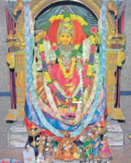
ఘటికేసర్: అన్నోజిగూడలో గాయత్రీ ఆలయంలో మహాశక్తి అవతారంలో అమ్మవారి దర్శనం