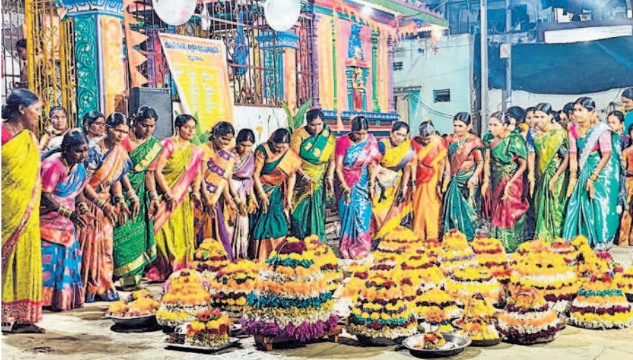
మేడ్చల్ పట్టణంలోని రామవేంద్ర కాలనీలో బతుకమ్మ అడుతున్న మహిళలు