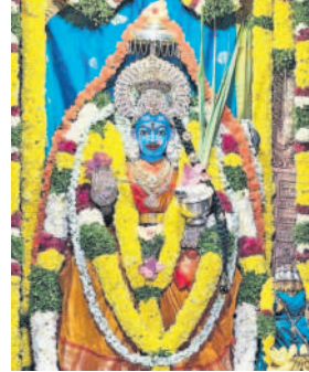
శామీరపేట: తూంతుల గాయత్రీ మహాశక్తిలో అమ్మవారి దర్శనం