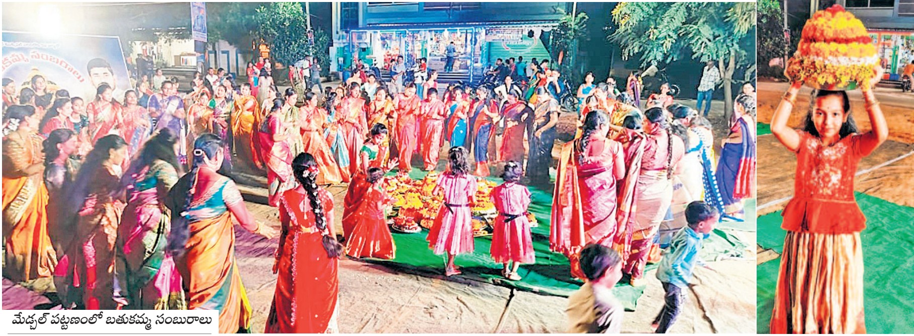
మేడ్చల్ పట్టణంలో బతుకమ్మ సంబురాలు