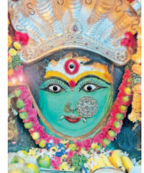
మేడ్చల్ పట్టణంలో రాజారాజేశ్వరి దేవిగా గడిమైనమ్మ తల్లి