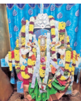
కీసర్ గుట్టలో అమ్మవారు శ్రీ మహాశక్తిగా భజనాలకు దర్శనం