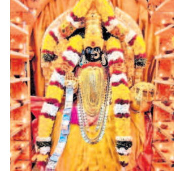
బోప్పల్: నిమిషాంధికాదేవి ఆలయంలో మహాశక్తిదేవిగా దర్శనం