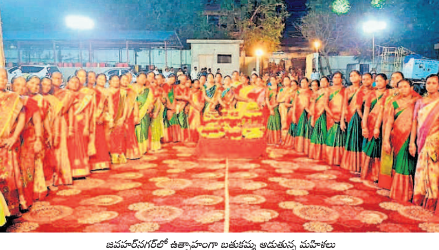
జవహర్ నగర్ లో ఉత్సాహంగా బతుకమ్మ అడుతున్న మహిళలు