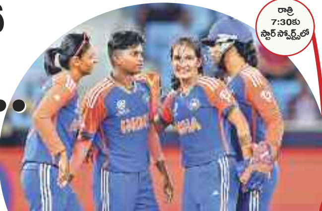
రాత్రి 7:30కు స్టార్ స్కాన్ కోడ్

దుబాయ్: ఐసీసీ మహిళల టీ20 ప్రపంచకప్ టోర్నీ బుధవారం మరో కీలక పోరుకు తెరలేపింది. సరికొత్తగా ఉన్న సెమీస్ అవకాశాలను దాటుకుని రేసులో నిలవాలంటే భారీ తేడాతో గెలవాల్సిన మ్యాచ్ భారత్ మహిళల క్రికెట్ జట్టు సిద్ధమైంది. గ్రూప్-ఎలో భాగంగా దుబాయ్ వేదికగా బుధవారం రాత్రి టీమ్ ఇండియా.. శ్రీలంకతో తలపడనుంది. నెట్ రన్ రేట్ అత్యంత కీలకమైన భారత్ కు ఈ మ్యాచ్లో అనాధారణ ఆటతీరుతో ప్రత్యర్థిని ఓడిస్తేనే సెమీస్ అవకాశాలు మెరుగుపరుతాయి. గ్రూప్-ఎలో పాకిస్తాన్తో పాటు రెండో మ్యాచ్లు ఆడినా భారత్ నెట్ రన్ రేట్ - 1.1277 నాలుగో స్థానంలో ఉండగా పాకిస్థాన్ 1.0055తో మూడో స్థానం ఉంది. ఈ నేపథ్యంలో లంకతో మ్యాచ్లో భారీ తేడాతో గెలిస్తేనే భారత్ సెమీస్ రేసులో నిలుస్తుంది.