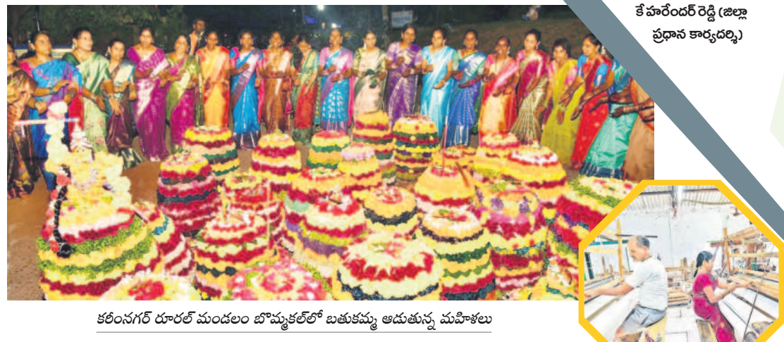
కరీంనగర్ రూరల్ మండలం బొమ్మకల్లో బతుకమ్మ ఆడుతున్న మహిళలు

ఆడబిడ్డల అతిపెద్ద పండుగైన బతుకమ్మ వేడుకలపై రాష్ట్ర ప్రభుత్వం అంతులేని నిర్లక్ష్యం చూపుతున్నది. గత బీఆర్ఎస్ ప్రభుత్వం ఏడాది బతుకమ్మ ఏర్పాటు కోసం ప్రతి జిల్లాకు ₹10 లక్షలు కేటాయించినా.. ఈసారి మాత్రం అణాపైసా కేటాయింపలేదు. దీంతో పంచాయతీలు, మున్సిపాలిటీల్లో అధికారులు ఏర్పాట్లపై చేతులెత్తారు. మరోవైపు 'బతుకమ్మ కేసు' నా తెలంగాణ అక్కాచెల్లెళ్లకు, అప్పలకు ఈసారి రెండేసి వేల చొప్పున అందజేస్తాం' అని, సీఎం రేవంత్ రెడ్డి మాట.. ఆవరణకు నోచుకోక పోవడంపై మహిళలు అగ్రహం వ్యక్తం చేస్తున్నారు. ఈ ప్రభుత్వం తమను చిన్న చూపు చూస్తున్నది. మాటలే తప్ప చేతలేవంటూ మండిపాటు.