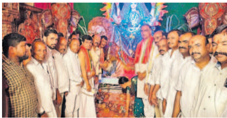
అమ్మవారి అనుగ్రహంతో శుభం కలుగాలి

అమ్మవారి అనుగ్రహంతో శుభం కలుగాలి. అమ్మవారి అనుగ్రహంతో శుభం కలుగాలి.