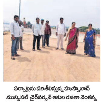
ఏర్పాట్లను పరిశీలిస్తున్న హుస్సాబాద్ మున్సిపల్ చైర్మన్, అధికారి

హుస్సాబాద్ లో, అక్టోబర్ 7: పట్టణంలో బతుకమ్మ ఏర్పాట్ల పరిశీలన. పట్టణంలో బతుకమ్మ ఉత్సవాలకు మహిళలు, నిమజ్జనం చేస్తున్న ఉద్యోగులు. ఈ కార్యక్రమం ప్రజాప్రతినిధులు, అధికారులు పాల్గొన్నారు.