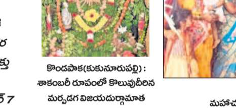
దేవీ శరణ్వహారిణి ఉత్సవాల వైభవంగా కొనసాగుతున్నాయి

దేవీ శరణ్వహారిణి ఉత్సవాల వైభవంగా కొనసాగుతున్నాయి. దేవీ శరణ్వహారిణి ఉత్సవాల వైభవంగా కొనసాగుతున్నాయి.