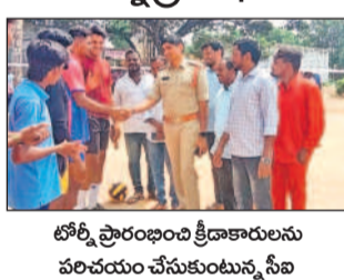
కడపల్లో జిల్లా స్థాయి టోర్నీ ప్రారంభం

చేర్లూరు, అక్టోబర్ 7: కడపల్లో జిల్లా స్థాయి టోర్నీ ప్రారంభం. చేర్లూరు, అక్టోబర్ 7: కడపల్లో జిల్లా స్థాయి టోర్నీ ప్రారంభం.