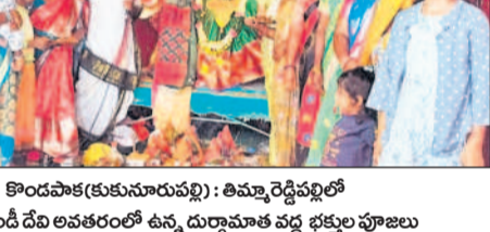
అమ్మవారి అనుగ్రహంతో శుభం కలుగాలి