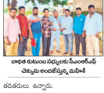
సీఎం రిలిఫ్ ఫండ్ చెక్కులు అందజేత

కోమర్లపల్లి, అక్టోబర్ 7: సీఎం రిలిఫ్ ఫండ్ చెక్కులు అందజేత. కోమర్లపల్లి, అక్టోబర్ 7: సీఎం రిలిఫ్ ఫండ్ చెక్కులు అందజేత.