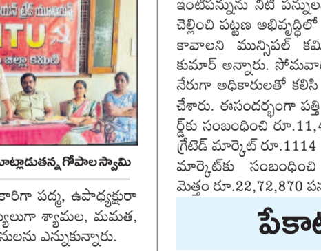
అల్పలతో వెట్టి చాకిరి చేయిస్తున్న ప్రభుత్వం

సిద్దిపేట, అక్టోబర్ 7: అల్పలతో వెట్టి చాకిరి చేయిస్తున్న ప్రభుత్వం. సిద్దిపేట, అక్టోబర్ 7: అల్పలతో వెట్టి చాకిరి చేయిస్తున్న ప్రభుత్వం.