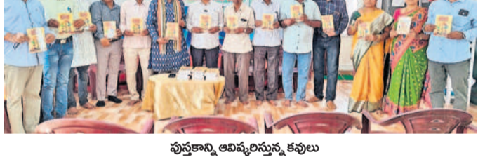
పద్మ సాహిత్యం సమాజానికి అవసరం

సిద్దిపేట లో, అక్టోబర్ 7: పద్మ సాహిత్యం సమాజానికి అవసరం. పద్మ సాహిత్యం సమాజానికి అవసరం. పద్మ సాహిత్యం సమాజానికి అవసరం.