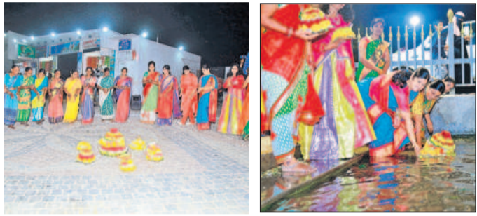
కోమటి చెరువులో బతుకమ్మ ఉత్సవాలకు మహిళలు, నిమజ్జనం చేస్తున్న ఉద్యోగులు

సిద్దిపేట, అక్టోబర్ 7: సిద్దిపేట పట్టణంలో బతుకమ్మ ఉత్సవాలకు మహిళలు, నిమజ్జనం చేస్తున్న ఉద్యోగులు. ఈ కార్యక్రమం ప్రజాప్రతినిధులు, అధికారులు పాల్గొన్నారు.