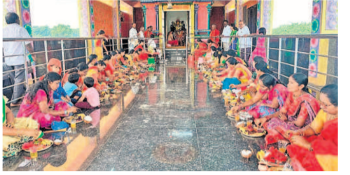
మధ్య గ్రామంలో పూజలు చేస్తున్న మహిళలు