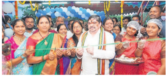
హుస్సాబాద్ లో క్యాంపిన్ ప్రారంభం

హుస్సాబాద్ లో, అక్టోబర్ 7: మహిళా శక్తి క్యాంపిన్ ప్రారంభం. ప్రభుత్వం ద్వారా నిర్వహించబడే ఈ కార్యక్రమం మహిళలకు వివిధ విద్యా మరియు ఉద్యోగ అవకాశాలను అందించే లక్ష్యంతో ఉంటుంది.