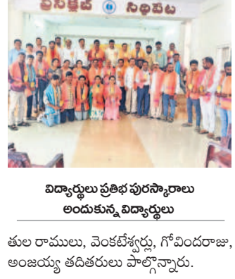
కురుమ విద్యార్థులకు పురస్కారాలు అందజేత

సిద్దిపేట లో, అక్టోబర్ 7: కురుమ విద్యార్థులకు పురస్కారాలు అందజేత. కురుమ విద్యార్థులకు పురస్కారాలు అందజేత.