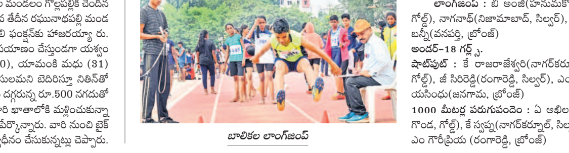
బాలికల లాంగ్ జంప్