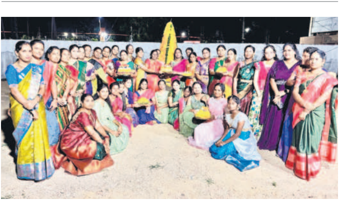
బతుకమ్మలతో స్వర్ణకార సంఘం మహిళలు

గ్రామ దేవతలకు, వివిధ మండపాల వద్ద కొలువుదీరిన దుర్గాదేవి ప్రతిమలకు ప్రత్యేక పూజలు చేశారు. దీక్షాదారులు, మహిళలు, చిన్నారులు, భక్తులు, తదితరులు పాల్గొన్నారు.