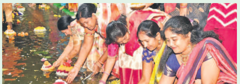
సిద్దిపేట జిల్లా కోమటి చెరువులో బతుకమ్మలను నిమజ్జనం చేస్తున్న మహిళలు