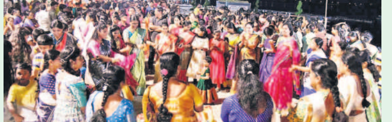
సిద్దిపేట జిల్లా కోమటి చెరువు కేలాం అడుతున్న మహిళలు