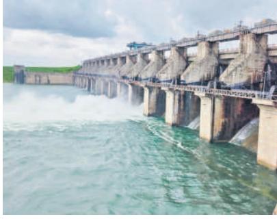
ప్రాజెక్టు రెండు గేట్లు ఎత్తివేత దిగువకు వెళ్తున్న జలాల

పుల్లూర్, అక్టోబర్ 6: సంగారెడ్డి జిల్లా పుల్లూర్ మండలంలోని బాగారెడ్డి సింగూరు ప్రాజెక్టుకు ఇన్‌ఫో కోససాగుతున్నది. ఆది వారం 6, 11 నంబర్ రెండు గేట్లు 1.50 మీటర్లు ఎత్తి 11026 క్యూసెక్కుల నీటిని దిగువకు విడుదల చేశారు. విద్యుత్ ఉత్పత్తి కోసం జనకోశం 2796 క్యూసెక్కుల నీటిని విడుదల చేస్తున్నారు. ఆదివారం 14182 క్యూసెక్కుల ఇన్‌ఫో, 19738 క్యూసెక్కుల బెటోఫో కోససాగునట్లు ప్రాజెక్టు ఏతా మహిళాలోకే తెలిపారు. ప్రాజెక్టు పూర్తి సామర్థ్యం 29.917 టీఎంసీలు కాగా, 29.708 టీఎంసీలు నీరు నిల్వ ఉన్నట్లు అధికారులు వెల్లడించారు