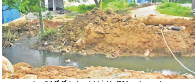
సంగారెడ్డిలో రోడ్డు తవ్విన వరకే నిర్మాణం తొలిగించిన అధికారులు

సంగారెడ్డి, అక్టోబర్ 6: ఇటీవల కురిసిన భారీ వర్షాలకు సంగారెడ్డిలోని ఎర్రకుంటపై అనుభవం గురిచేసింది. వరకే తో మల్కాపూర్ నుంచి రాజంపేట వయా సంగారెడ్డికి రావాలంటే ఈ రోడ్డు గుండా రవాణా చేసేవారు. కానీ, రోడ్డును తవ్వడంతో వారి ప్రయాణానికి లోకపడింది. వరకే దిబ్బు కాల్చిలో మాజీ ఎమ్మెల్యే జగ్గారెడ్డి పర్యటివేని సమస్యను పరిష్కరించాలని అధికారులకు ఆదేశించారు. ఆయన ఆదేశాలతో వరకే నీటిని తోలిగించేందుకు వెంటనే పీఆర్ ఇంజనీరింగ్, ఇరిగేషన్, మున్సిపల్ అధికారులు సమన్వయంతో మల్కాపూర్ నుంచి రాజంపేటకు వచ్చే పీఆర్ రోడ్డును తవ్వేశారు. కానీ, తవ్విన రోడ్డును పునర్నిర్మించడానికి చర్యలు తీసుకోకపోవడంతో ఈ రోడ్డు గుండా రాక