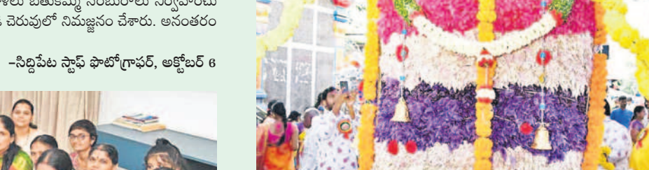
సిద్దిపేట దాసాంజనేయ ఫ్యామిలీ అసోసియేషన్ ఆధ్వర్యంలో ఎనిమిది వేల బతుకమ్మ

అన్నారు. మండలంలోని కంకోర్ గ్రామ శివారులో నూతనంగా నిర్మించే ట్రామాకేర్ సెంటర్ నిర్మాణ స్థలాన్ని ఆదివారం ఆయన పరిశీలించారు. ఈ సంద