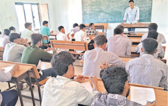
సంగారెడ్డి జిల్లాలో విద్యార్థులకు బోధిస్తున్న అతిథి అధ్యాపకుడు

సంగారెడ్డి కలెక్టరేట్, అక్టోబర్ 6: బతుకమ్మ, దసరా, దీపావళి పండుగలు సమీపిస్తున్నా వేతనాల రాకపోవడంతో అతిథి అధ్యాపకులు పన్నులు ఉండాలన్న పరిస్థితి ఏర్పడింది. అలెక్సా వేతనాలతో సేవలందిస్తున్న అతిథి అధ్యాపకులకు వచ్చే కనీస వేతనాలు సమయానికి అందక అప్పుల ఊబిలో కూరుకుపోతున్నారు. గత విద్యా సంవత్సరానికి సంబంధించి జూలై, ఆగస్టు, సెప్టెంబర్ మొత్తం 4నెలల వేతనాలు పెండింగ్లో ఉన్నాయి. జిల్లాలో మొత్తం 7 ప్రభుత్వ డిగ్రీ కళాశాలలు ఉండగా, ఆయా కళాశాలల్లో మొత్తం 90 మంది అతిథి అధ్యాపకులు విడుదల నిర్వహిస్తున్నారు. సంగారెడ్డిలోని తారా ప్రభుత్వ డిగ్రీ, పీజీ కళాశాలలో 34 మంది విడుదల నిర్వహిస్తుండగా, చుట్టూ ప్రభుత్వ కళాశాలలో 19 మంది, నారాయణపేట ప్రభుత్వ డిగ్రీ కళాశాలలో 9 మంది, జోగిపేట ప్రభుత్వ డిగ్రీ కళాశాలలో 10 మంది, జూబిలాహిల్స్ ప్రభుత్వ డిగ్రీ కళాశాలలో 12 మంది, సదాశివపేట ప్రభుత్వ డిగ్రీ కళాశాలలో నలుగురు, సంగారెడ్డిలోని ప్రభుత్వ మహిళా డిగ్రీ కళాశాలలో ఇద్దరు అతిథి అధ్యాపకులు పని చేస్తున్నా