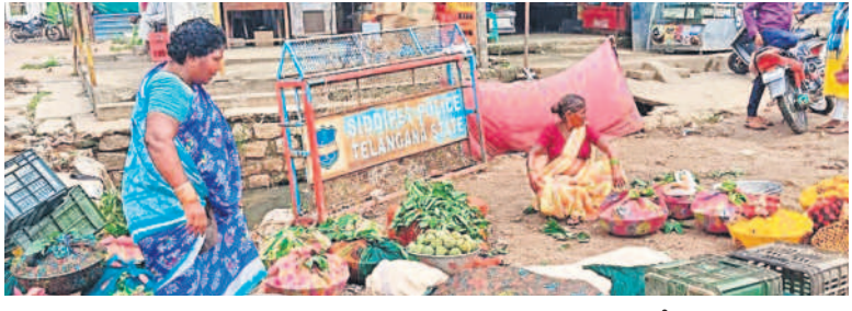
హుస్సాబాద్లో.. హుస్సాబాద్ బస్టాండ్ ప్రాంతంలో విక్రయిస్తున్న సీతాఫలాల