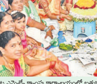
సిద్దిపేట ఎమ్మెల్యే క్యాంపు కార్యాలయంలో బతుకమ్మ వేడుకలు

సందడి చేశారు. సిద్దిపేట పట్టణంలో దాసాం జనేయ ఆర్గనైజ్ అసోసియేషన్ ఆధ్వర్యంలో 8 వేల బతుకమ్మను ఏర్పాటు చేసి ఉత్సవాలను ఆహ్లాదంగా నిర్వహించారు. కోమటి చెరువుపైనే పట్టణ మహిళలు బతుకమ్మ సలబురాలు నిర్వహించుకున్నారు. బతుకమ్మ ఆడి చెరువులో నిమజ్జనం చేశారు. అనంతరం పిండి వంటలు తిన్నారు.