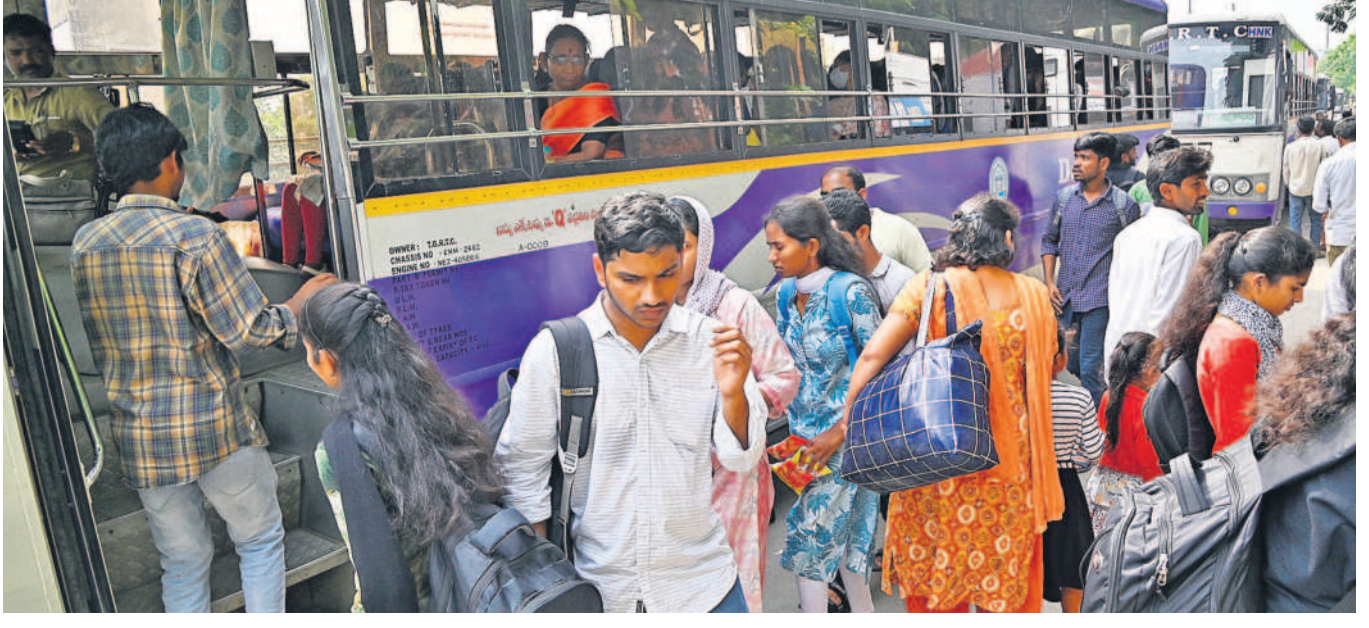
దసరా సమీపిస్తుండటంతో నగరవాసులు సాంతూర్ల బాటపడుతున్నారు. రైల్వే స్టేషన్లు, బస్స్టాండ్లలో ప్రతి రోజూ భారీగా రద్దీ ఉంటున్నది. ఆదివారం ప్రయాణికులతో కిక్కిరిసిన ఉప్పల్ చౌరస్తా