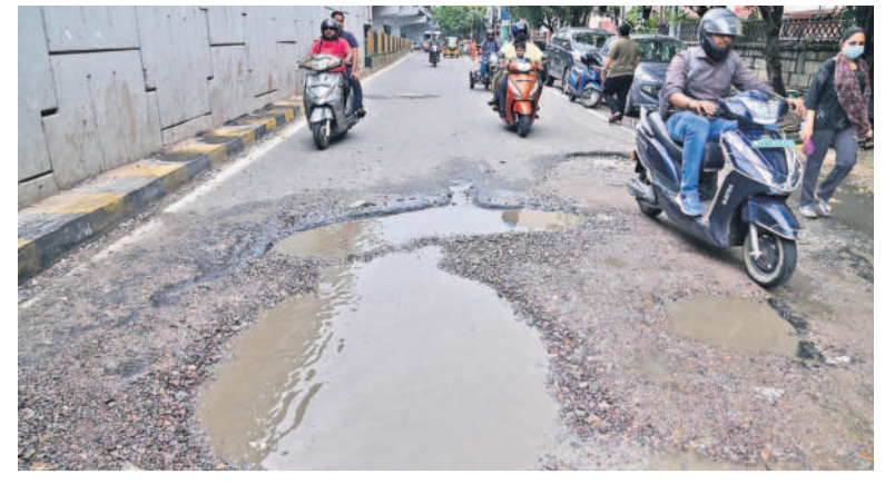
రహదారి..గుంతలుగా మారి ఇందరాపూర్ రోడ్డు దుస్థితి ఇది..