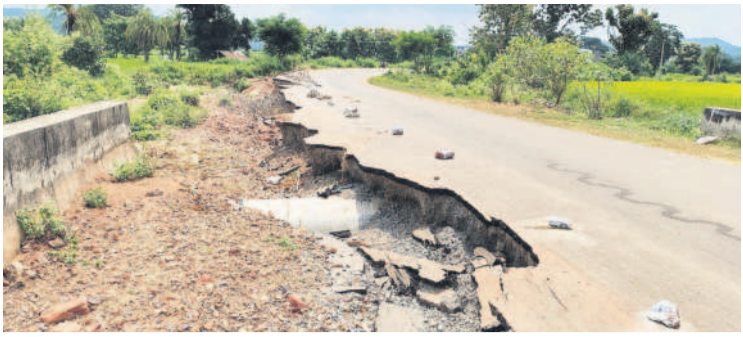
కేసీఆర్ తండా శివారులో కోతకు గురి ప్రమాదాలకు నిలయంగా మారిన రోడ్డు