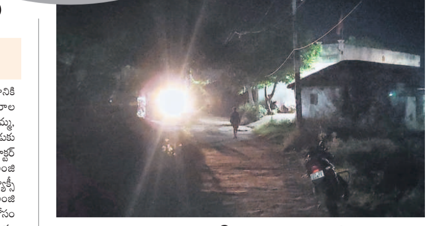
రాజన్నపేటలో వీధిల్లెట్లు లేక నెలకొన్న చీకటి

అధికారులకు ముడుపుల వ్యవహారం బహిష్కరింపు తీరు ప్రస్తుతం అధికారుల్లో కలకలం రేపుతున్నది. మరోవైపు ఇవ్వని డబ్బులను ఇచ్చినట్లు రికార్డుల్లో చూపిన అసోసియేషన్ తీరుపైనా మిల్లర్లలో పెద్ద చర్చ నడుస్తున్నది. దీంతో పాటు అసోసియేషన్లో జరిగిన అక్రమాలు, లావాదేవీల తీరు తెన్నులను కొంత మంది మిల్లర్లు ఆధారాలతో సహా ఓ ఉన్నతాధికారికి సమర్పించినట్లు తెలుస్తున్నది. మరోవైపు ముడుపుల వ్యవహారం ప్రస్తుతం జిల్లాలోనే కాదు, రాష్ట్రంలోనూ చర్చకు దారి తీసింది. దీంతో కలెక్టర్ పవేల సత్కర్మ అసోసియేషన్ అత్యంత సీరియస్ గా తీసుకున్నట్లు విశ్వసనీయ సమాచారం. అక్కడే ఆగకుండా తనకు అత్యంత సమ్మతమైన అధికారంతో ఒక వైపు వివరాలను సేకరిస్తూ, పూర్తిస్థాయిలో కూపి లాగుతున్నట్లు తెలిసింది. ఇదిలా ఉండగా పైనుంచి వచ్చిన ఆదేశాల మేరకు మిల్లర్స్ అసోసియేషన్ కు అడిషనల్ కలెక్టర్ నోటీస్ ఇచ్చారు. దీనిపై పూర్తి స్థాయిలో వివరణ ఇవ్వాలని సదరు నోటీస్ లో స్పష్టం చేసినట్లు తెలుస్తున్నది.