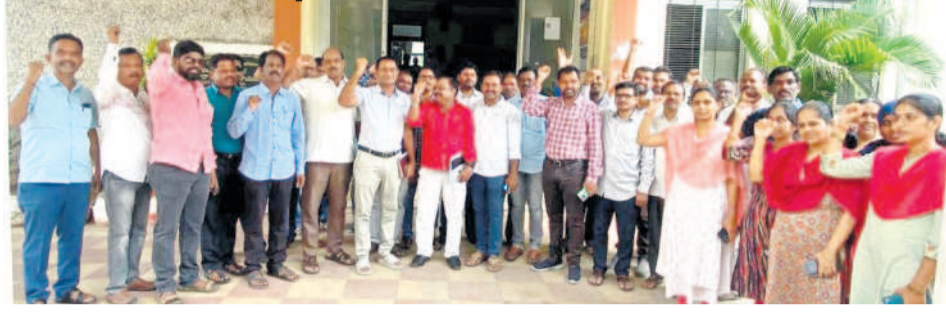
కరీంనగర్: విద్యుత్ కార్యాలయం ఎదుట నిరసన తెలుపుతున్న విద్యుత్ ఉద్యోగులు

ముకరంపూర్, అక్టోబర్ 5: ప్రభుత్వం ఏకపక్ష నిర్ణయాలతో విద్యుత్ సంస్థలను నిర్వీర్యం చేయవద్దని విద్యుత్ ఉద్యోగుల జేపీసీ నాయకులు కోరారు. విద్యుత్ విషయంలో ప్రభుత్వ నిర్ణయాలను వ్యతిరేకిస్తూ కరీంనగర్ సర్కిల్ విద్యుత్ ఉద్యోగుల జేపీసీ ఆధ్వర్యంలో శనివారం భోజన విరామ సమయంలో నిరసన తెలిపారు. ఈ సందర్భంగా జేపీసీ నాయకులు మాట్లాడుతూ ప్రస్తుతం జనరేటింగ్ సౌకర్యం లాభాల్లో ఉన్నాయని, మంచి పీక్ లోడ్ ఫ్యాక్టర్ (పీఎల్ఎఫ్)తో సదున్నాయని తెలిపారు.