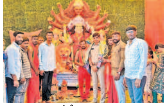
చేర్యాలలో సీబిఎస్ సన్మానిస్తున్న దేవీ స్నేహ యాత్రా సభ్యులు

చేర్యాల, అక్టోబర్ 5 : యువజన సంఘాలు గణపతి, దుర్గాదేవి శరన్నవరాత్రి ఉత్సవాలు పాటు సామాజిక సేవా కార్యక్రమాలు ప్రారంభించాలని సీబిఎస్ శ్రీను కోరారు. పట్టణంలోని స్థానిక వాణిజ్య వద్ద దేవీ స్నేహ యాత్రా అసోసియేషన్ ఆధ్వర్యంలో 22 ఏండ్ల డ్యూ నిర్వహిస్తున్న దుర్గాదేవి శరన్నవరాత్రి ఉత్సవాలలో భాగంగా సీబిఎస్ మండలపట్టణ సందర్భించి అమ్మవారిని దర్శించుకుని పూజలు నిర్వహించారు. అనంతరం సీబిఎస్ కార్యక్రమంలో నిర్వహించారు. ఈ సందర్భంగా రాజు ఆధ్వర్యంలో నిర్వహించిన