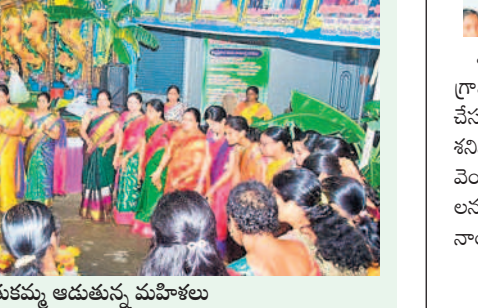
సిద్దిపేట: బతుకమ్మ ఆడుతున్న మహిళలు