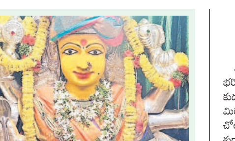
కోండపాక: అన్నపూర్ణమాతగా కొలువుదీరిన మర్దడగ విజయదర్శి