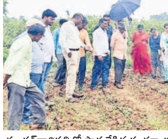
కుందనవానిపల్లిలో సాగువేసిన కూరగాయ పంటలను పరిశీలిస్తున్న అధికారులు