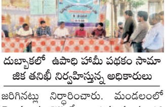
దుబ్బాకలో ఉపాధి హామీ పథకం సామాజిక తనిఖీ నిర్వహిస్తున్న అధికారులు

దుబ్బాక, అక్టోబర్ 5: దుబ్బాక ఎంపీడియో కార్యాలయం పద్ద శనివారం ఉపాధిహామీ పథకం సామాజిక తనిఖీ ప్రణాళిక నిర్వహించారు. మహాత్మాగాంధీ జాతీయ గ్రామీణ ఉపాధి హామీ పథకం 15వ వార్షిక సామాజిక తనిఖీలో ఏపీడి బాలకృష్ణ పాల్గొన్నారు. ఇందులో ఘన విద్యాలలో పాల్గొని సిబ్బంది చేసిన పారాపాటు తనిఖీలకు సమస్యలను నివేదికతో వివరించారు. పలు గ్రామాల్లో ఉపాధిహామీలో కూలీలకు చెల్లించిన డబ్బులు, మొక్కల నాణ్యత కార్యక్రమంలో అవకాశాలు