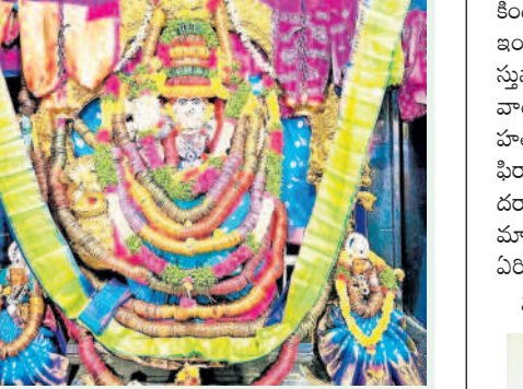
గజ్వేల్: గాజులతో మహాసాగి అమ్మవారి అలంకరణ