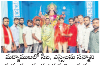
మర్నాడులో సీబిఎస్, ఎస్సెలను సన్మానిస్తున్న దుర్గాదేవి ఉత్సవ నిర్వహకులు

చేర్యాల, అక్టోబర్ 5 : యువజన సంఘాలు గణపతి, దుర్గాదేవి శరన్నవరాత్రి ఉత్సవాలు పాటు సామాజిక సేవా కార్యక్రమాలు ప్రారంభించాలని సీబిఎస్ శ్రీను కోరారు. పట్టణంలోని స్థానిక వాణిజ్య వద్ద దేవీ స్నేహ యాత్రా అసోసియేషన్ ఆధ్వర్యంలో 22 ఏండ్ల డ్యూ నిర్వహిస్తున్న దుర్గాదేవి శరన్నవరాత్రి ఉత్సవాలలో భాగంగా సీబిఎస్ మండలపట్టణ సందర్భించి అమ్మవారిని దర్శించుకుని పూజలు నిర్వహించారు. అనంతరం సీబిఎస్ కార్యక్రమంలో నిర్వహించారు. ఈ సందర్భంగా రాజు ఆధ్వర్యంలో నిర్వహించిన