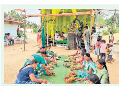
మిరుదొడ్డి: దేర్గాడేవి అమ్మవారికి కుంకుమార్చన చేస్తున్న మహిళలు

జరిగినట్లు నిర్వహించారు. మండలంలో మొత్తం రూ. 75 వేలు జరిమానా, రూ.48 వేలు రికవరీ ఆదేశించినట్లు ఎంపీడియో భాగ్యశాస్త్రి తెలిపారు.