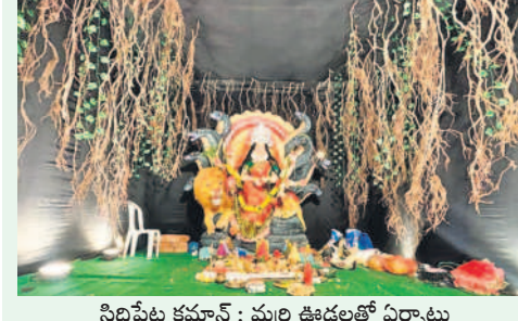
సిద్దిపేట కమన్స్: మర్రి ఊడలతో ఏర్పాటు చేసిన మండపంలో దర్శనమిస్తున్న అమ్మవారు