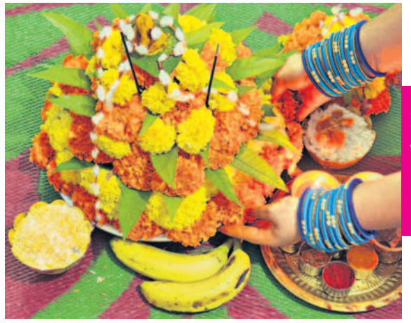
ఇలాటి అట్ల బతుకమ్మ

తోమ్మిది రోజులు బతుకమ్మకు పెట్టే ప్రసాదాల్లో సవదాన్యాల వచ్చేట్టుగా చూడాలంటారు. అటుకుల చూపంలో బియ్యం, ముద్ద పప్పులో కందులు, పెసరపప్పు నివేదిస్తారు. ఇలా సమర్పించే నైవేద్యాల ఔషధ గుణాలు కలిగి ఆరోగ్యాన్ని ప్రసాదిస్తాయి. అట్ల బతుకమ్మ సందర్భంగా పెసర్లు, బియ్యంతో చేసిన అట్లను నివేదిస్తారు. సాధారణంగా అట్ల ఎక్కువగా మినములతో చేసే కంటారు. మినముల్లో మాంసకృతులు ఎక్కువగా ఉంటాయి. బలవర్ధకమైన ఆహారమే అయినా ఎక్కువగా వాడితే బుద్ధి మాంద్యం ఏర్పడుతుంది. పెసర్లు జీర్ణశక్తిని పెంచుతాయి. జ్ఞాపకశక్తిని పెంపొందిస్తాయి. అందుకే తెలంగాణలో అట్ల బతుకమ్మ సందర్భంగా పెసరపప్పుతో చేసిన అట్లను నైవేద్యంగా పెడుతారు.