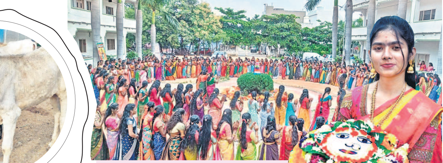
జిల్లాలో బతుకమ్మ సంబరాలు వైభవంగా సాగుతున్నాయి. నాలుగో రోజు నానేలియ్యం బతుకమ్మను పేర్చి మహాళలు, యువతులు ఆడిచారు. కామారెడ్డిలోని ఆదర్శ కాలేజీ, ఎస్ఆర్ కె, సాంబిపని డిగ్రీ కళాశాలల్లో శనివారం బతుకమ్మ వేడుకలను నిర్వహించారు. అధ్యాపకులు, విద్యార్థులు బతుకమ్మ పాటలకు అలలుబద్ధంగా స్టెప్పులు వేస్తూ సందడి చేశారు.