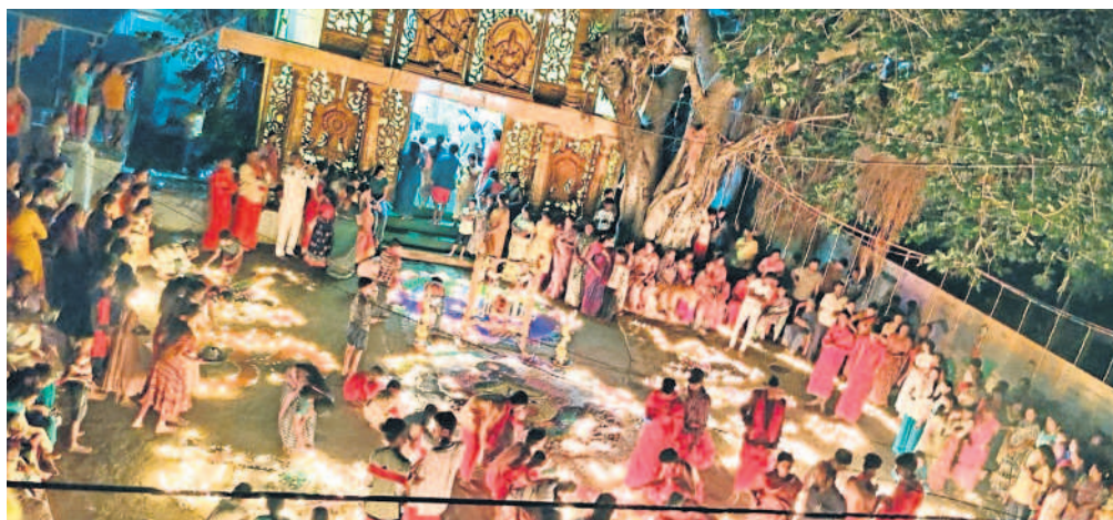
జిల్లాలో దేవీ శరన్నవరాత్రోత్సవాలు అంగరంగ వైభవంగా సాగుతున్నాయి. భిక్షుసూర మండలం జంగంపల్లిలో శనివారం దీపారాధన కార్యక్రమం నిర్వహించారు. దీపాల వెలుగుల్లో దేవీ మండప పరిసరాలూ కోటి కాంతలతో తళుకుతీనాయి.