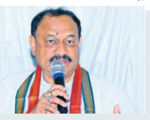
హైద్రాను జిల్లాలకు విస్తరిస్తాం..