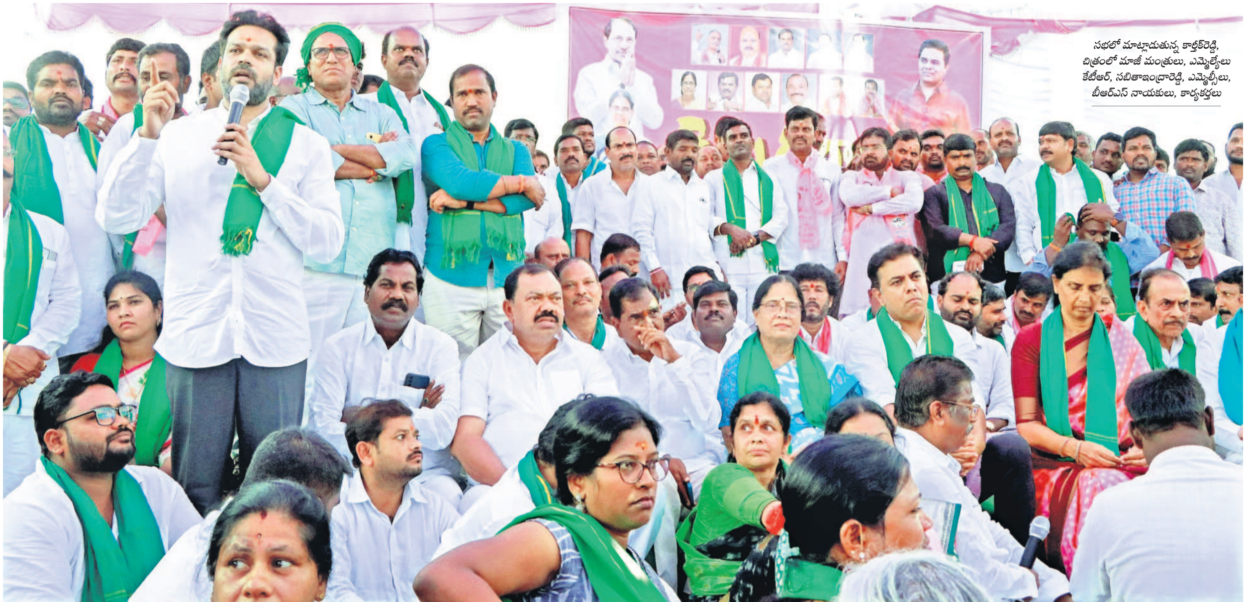
నభల్ మాట్లాడుతున్న కార్మికరెడ్డి, చిత్రంలో మాజీ మంత్రులు, ఎమ్మెల్యేలు కేటీఆర్, సబితా ఇంద్రారెడ్డి, ఎమ్మెల్యేలు, బీఆర్ఎస్ నాయకులు, కార్యకర్తలు