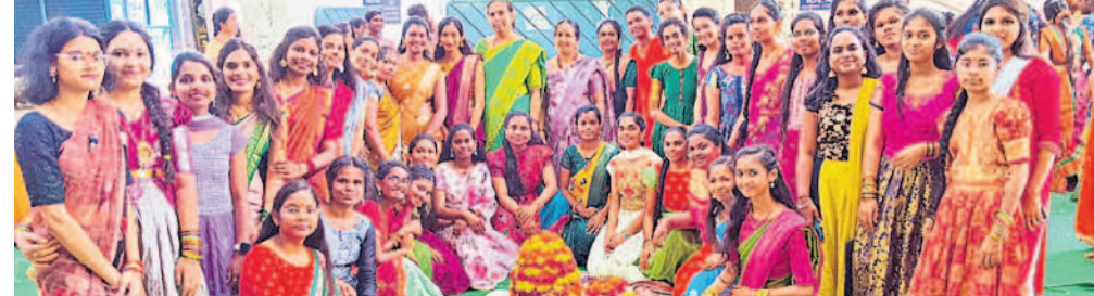
బిల్వేనగర్ లోని బడివల్ మహిళా డిగ్రీ కళాశాలలో నిర్వహించిన బతుకమ్మ వేడుకల్లో అధ్యాపకులు, విద్యార్థినులు

తెలంగాణ సంస్కృతి సంప్రదాయాలకు ప్రతీక అయిన బతుకమ్మ సంబురాలను బిల్వేనగర్ లోని సిద్ధార్థ మహిళా డిగ్రీ కళాశాల, అనిలినెంట్ మహిళా డిగ్రీ కళాశాల, అవంతి డిగ్రీ, పీజీ కళాశాల, బడివల్ మహిళా డిగ్రీ కళాశాల, శ్రీసాయి డిగ్రీ, పీజీ కళాశాల, న్యూ నోబుల్ డిగ్రీ కళాశాలలో అధ్యాపకులు, విద్యార్థినులు వైభవంగా జరుపుకొన్నారు. - మలక్పేట, అక్టోబర్ 5