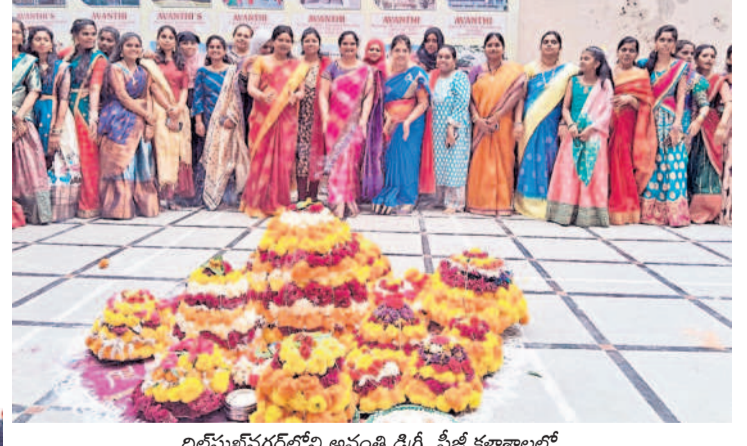
బిల్వేనగర్ లోని అవంతి డిగ్రీ, పీజీ కళాశాలలో..