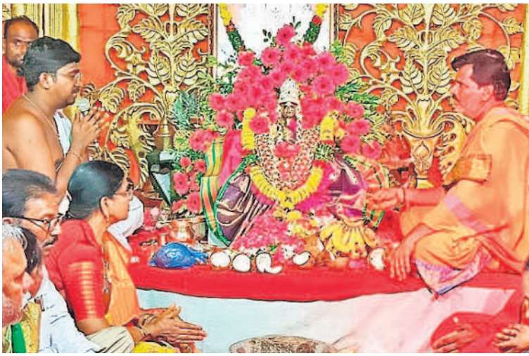
బ్రహ్మచారిణి (గాయత్రీ దేవి) రూపంలో అమ్మవారు