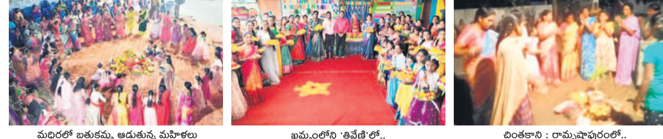
మధిరలో బతుకమ్మ ఆడుతున్న మహిళలు | ఖమ్మంలోని 'త్రివేణి'లో.. | చింతకాసి: రామస్వామిపురిలో..