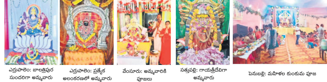
ఎర్రపాలెం: బాలత్వితర సుందరిగా అమ్మవారు | ఎర్రపాలెం: ప్రత్యేక అలంకరణలో అమ్మవారు | వేంసూరు: అమ్మవారికి పూజలు | సత్తుపల్లి: గాయత్రీదేవిగా అమ్మవారు | పెనుబల్లి: మహిళల కుంకుమ పూజ