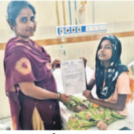
ఎల్.వో.సీ. అందజేస్తున్న ఎంపీ కార్యాలయం సిబ్బంది