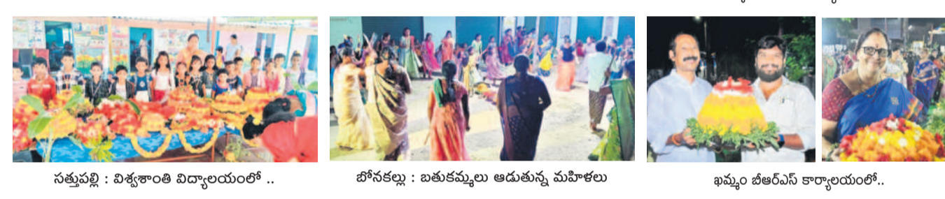
సత్తుపల్లి : విశ్వానాథి విద్యాలయంలో.. | బోసకల్లు : బతుకమ్మలు ఆడుతున్న మహిళలు | ఖమ్మం బీఆర్.ఎస్ కార్యాలయంలో..