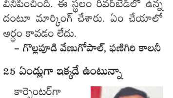
కొంట్లలోని మూసీ నిర్వాసితులు

ఇరువురూ రిటైనింగ్ వాల్ నిర్మించాలి. మూసీ లోయర్ లో ఉన్న వారికి కూడా తహసీల్దార్ కన్వెన్షన్ డిడ్ ఇచ్చారు. 1978లో గ్రామపంచాయితీ లే అప్పైట్ ఫ్యాబ్రిక్ - నల్లంపాడుకూడ, వెంకటపామ నగర్, చైతన్యపురి అప్పై చీని జాగ్రత్త కొనుగోలు అంతో శ్రమించి, ఉత్పత్తి సంపాదించి కూడబెట్టిన డబ్బులు, కొంత అప్పు చేసి జిల్లా వరద పడిన వారికి 160 గజాల స్థలాన్ని రూ.40 లక్షల కొనుగోలు చేశాను. ఇల్లు కట్టుకోవాలని కలలు కంటున్నాను. అంతలోనే పిడుగుపాటు వచ్చి