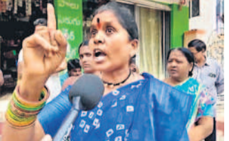
మంజుగ పుటల ఏషియన్

మూసీ పరీవాహక ప్రాంతాల్లో తహసీల్దార్ బృందాలు నిర్వాసితులను తరలిస్తున్న అధికారులు.. నిర్వాసితుల ఆవేదన హైదరాబాద్ సిటీ మున్సిపల్ కార్పొరేషన్ (సమస్తీ తెలంగాణ) : మూసీ ఆవేదన సర్ నరసింహారావు దడ బుట్టిస్తున్నది. తహసీల్దార్ బృందం మూసీ పరీవాహక ప్రాంతాల్లో నందీనగర్ నిర్వాసితులను ఒప్పించే యత్నం చేస్తున్నది. ఆ బృందాలను చూస్తేనే అక్కడి జనం బీజేపీలోకి వెళ్లారు. విడదీసి.. తరలిస్తే సీఎం రేవంత్ రెడ్డికి రక్షణ కవచంగా నిలుస్తున్నట్లు ఆయన పర్యటన ఇచ్చారు. 'ఎండ్ల తరబడి స్కేల్ల కట్టిన ఇండ్లను కూల్చాలి' అంటూ రఘునందన్ రావు వ్యాఖ్యలు చేశారు. అండ్లకు బ్యాంకు లోన్లు