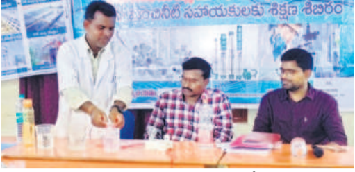
మంచినీటి స్వచ్ఛతను ప్రయోగశాలలో పరిశీలించి చూపుతున్న ఆర్డబ్ల్యుఎస్ అధికారులు

నాణ్యత, సరఫరాపై గురువారం నిర్వహించిన అవగాహన కార్యక్రమంలో ఆయన మాట్లాడారు. స్వచ్ఛమైన, పరిశుభ్రమైన నీటితోనే ప్రజల ఆరోగ్యం పరిరక్షణ సాధ్యమవుతుందన్నారు. ప్రజల ఆరోగ్యం కోసం స్వచ్ఛమైన నీటిని సరఫరా చేయాలని సహాయులకు సూచించారు. కార్యక్రమంలో ఎంపీ డీఈ ప్రశాంతకుమార్ అన్నారు. ఎంపీ డీఈ ప్రశాంతకుమార్ మిషన్ భగీరథ నీటి శ్రీలత పాల్గొన్నారు.