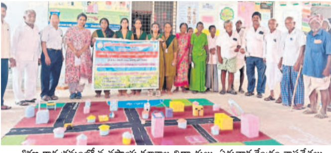
శిక్షణ కార్యక్రమంలో వ్యవసాయ కళాశాల విద్యార్థులు, ఏరువాక కేంద్రం శాస్త్రవేత్తలు

మోటోకాండూర్, అక్టోబర్ 3 : ప్రాథమిక విద్యార్థులకు నేల ఆరోగ్యం - జీవన ఎరువుల వాడకంపై అవగాహన కార్యక్రమం నిర్వహించారు. ప్రాథమిక విద్యార్థులకు నేల ఆరోగ్యం - జీవన ఎరువుల వాడకంపై అవగాహన కార్యక్రమం నిర్వహించారు. ప్రాథమిక విద్యార్థులకు నేల ఆరోగ్యం - జీవన ఎరువుల వాడకంపై అవగాహన కార్యక్రమం నిర్వహించారు.