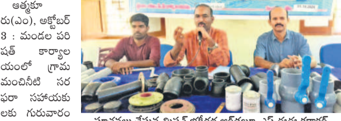
సూచనలు చేస్తున్న మిషన్ భగీరథ ఆర్డబ్ల్యుఎస్ ఈఈ కర్ణాకర్

నీటి సరఫరాకు అంతరాయం లేకుండా బ్యూటీని ఈఈ కర్ణాకర్ మాట్లాడుతూ గ్రామాల్లో నిరుపయోగంగా ఉన్న చేతి పంపులకు మరమ్మత్తులు చేయాలన్నారు. పైపు లైన్లు పగిలిపోతే వెంటనే మరమ్మత్తులు చేసి ఇంటింటికీ నల్ల కనెక్షన్లు ఇవ్వడంతోపాటు