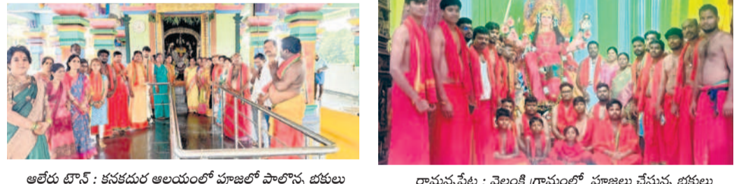
అలేరు రూరల్ : కనకదుర్గ అలయంలో పూజల్లో పాల్గొన్న భక్తులు