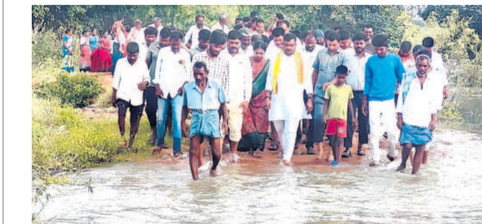
బీమలిగూడెంలో రోడ్డు ప్రవహిస్తున్న నీటిని పరిశీలిస్తున్న ప్రభుత్వ విప్ బీర్ల వెలయ్య

తుర్పల్, అక్టోబర్ 3 : మండలంలోని గంధమల గ్రామసంఘానికి పరిధి బీమలిగూడెంలో కల్వర్తు నిర్మాణానికి కృషి చేయనున్నట్లు ప్రభుత్వ విప్ బీర్ల వెలయ్య అన్నారు. గంధమల వెలుపల వెళ్తున్న గోదా నది గంధమల బీమలిగూడెం గ్రామ సమీపంలోని రోడ్డు ప్రవహిస్తుండడంతో రాకపోకలో తోక చెరువుకు నీటిని విడుదల చేసేందుకు జరుగుతున్న కార్య పనులను పరిశీలింపారు. కార్యక్రమంలో మార్కెట్ కమిటీ చైర్మన్ అయినా బీమలిగూడెం గ్రామంలోని కాల్యాణ సంఘం గ్రామస్థులతో మాట్లాడి దారు. సంబంధిత అధికారులతో మాట్లాడి