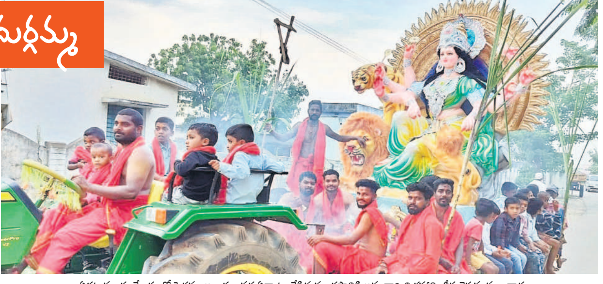
ఏర్లట్ల మండలకేంద్రంలో పెద్దపల్లె అలయం వద్ద ఏర్పాటు చేసిన మండపానికి అమ్మవారి విగ్రహాన్ని తీసుకెళ్తున్న మూలధారులు

భక్తుల పూజలందుకోసం జగజ్జనని దగ్గరకు విచ్చేసింది. అందంగా ముస్తాబు చేసిన మండపాల్లో కొలువు దీరింది. దసరా వేడుకల్లో భాగంగా అమ్మవారు తొలిరోజు గురువారం 'శైలవ్రతి'గా దర్శనమిచ్చింది. ఉమ్మడి జిల్లాలోని ఊరివారా అమ్మవారిని ప్రతిష్ఠించారు. దేవీ నవరాత్రి ఉత్సవాలలో భాగంగా తొమ్మిది రోజుల పాటు కనకదుర్గమ్మను రోజుకో అవతారంలో భక్తులు కొలుస్తుంటారు. - ఏర్లట్ల, అక్టోబర్ 3