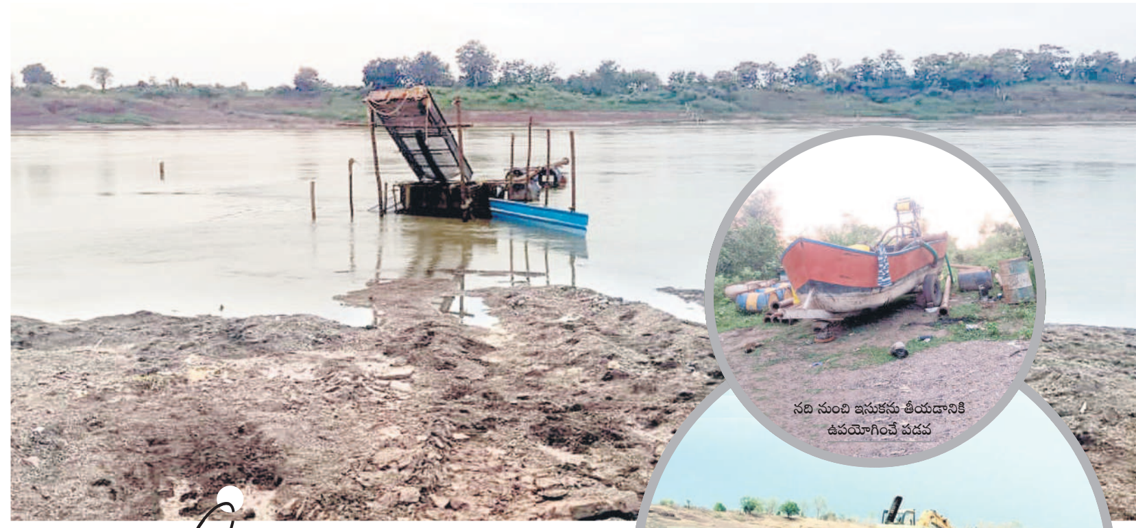
ఇసుకను పట్టడానికి ఏర్పాటు చేసిన జాలి బేల మండలంలోని కాంగారపూర్ పెన్గంగా వద్ద ఇసుక తీసేందుకు ఉపయోగిస్తున్న జేసీబీ

మామి బోనస్ నుంచి తప్పించుకునేందుకు ప్రభుత్వం క్యాలిబర్ల వంటి సూక్ష్మ కొలతల పరికరాలను తెర మీదికి తెస్తున్నట్లు విమర్శలు వినిపిస్తున్నాయి. గత యాసంగిలో బోనస్ ఇవ్వకుండా ఎగవేసిన కాంగ్రెస్ ప్రభుత్వం, ఈ వానకాలంలోనైనా ఇస్తుందో లేదో అన్న అనుమానాలు వ్యక్తమవుతున్నాయి. అయితే ఇప్పటి వరకు బోనస్పై విధివిధానాలు ఖరారు కాకపోవడం గందరగోళానికి కారణమవుతున్నది. బోనస్పై ప్రభుత్వం నుంచి స్పష్టత రాకపోవడంతో రైతుల్లో అయోమయం నెలకొన్నది. ఈసారి జిల్లాలో 1.35 లక్ష ఎకరాల్లో పని సాగు చేయగా.. 62,970 మెట్రిక్ టన్నుల సస్పరకం ధాన్యం దిగుబడులు వస్తాయని వ్యవసాయ శాఖ అధికారులు అంచనా వేశారు. ఒకవేళ ప్రభుత్వం బోనస్ ఇవ్వకపోతే మళ్లీ ధాన్యాలనే ఆశ్రయించాల్సి వస్తుంది. మరోసారి బోనస్ పేరిట రైతులను మోసం చేసేందుకు సిద్ధమవుతున్నట్లు చెబుతున్నారు.