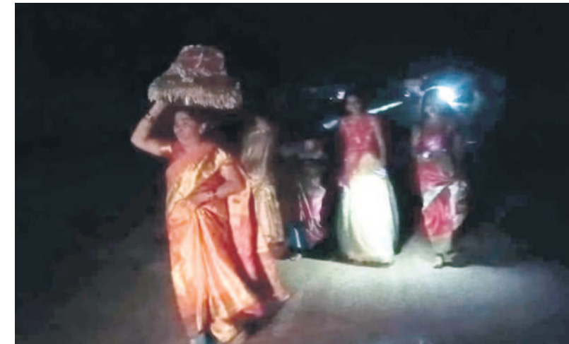
చీకట్లనే శోభాయాత్రగా సరస్వతీ అమ్మవారి కోనేరుకు వెళ్తున్న మహిళలు