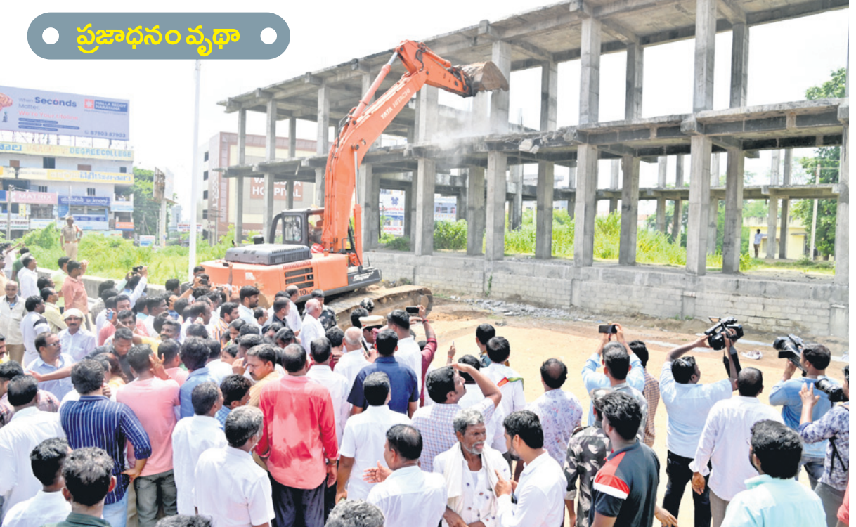
మంచిర్యాల జిల్లా కేంద్రంలోని ఇంటిగ్రేటెడ్ మార్కెట్ను కూల్చివేస్తున్న జేసీబీ

మంచిర్యాల, అక్టోబర్ 3 (నమస్తే తెలంగాణ ప్రతినిధి) : మంచిర్యాల జిల్లా కేంద్రంలో కోట్లాది రూపాయల విలువ చేసే ప్రభుత్వ ఆస్తులను అధికార పార్టీ నేలమట్టం చేయడం విమర్శలకు తావిస్తున్నది. మాతా శిశు సంరక్షణ కేంద్రం ఏర్పాటు పేరిట నిర్మాణ దళతో ఉన్న ఇంటిగ్రేటెడ్ వెజ్ అండ్ నాన్ వెజ్ మార్కెట్ బిల్డింగ్ కూల్చివేతను స్వయంగా ఎమ్మెల్యే పీఎస్సార్ ప్రారంభించడం స్థానికంగా చర్చనీయాంశమవుతున్నది. ఎలాంటి అనుమతులు లేకుండానే ప్రజాధనం వ్యర్థం చేయడమేమిటన్న ప్రశ్న ఆతెత్తుతున్నది.