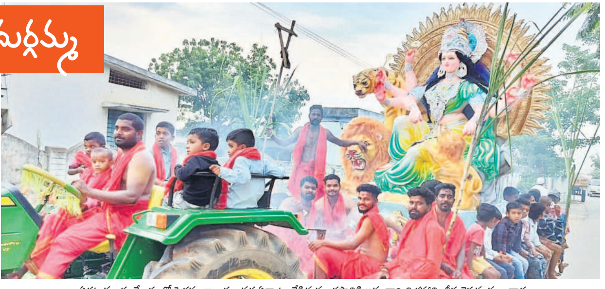
విగ్రహ మండలకేంద్రంలో పెద్దపల్లె అలయం వద్ద ఏర్పాటు చేసిన మండపానికి అమ్మవారి విగ్రహాన్ని తీసుకెళ్తున్న మూలధారులు

భక్తుల పూజలందుకొన జగజ్జనని దుర్గమ్మ విచ్చేసింది. అందంగా ముస్తాబు చేసిన మండపాల్లో కొలువు దీరింది. దసరా వేడుకల్లో భాగంగా అమ్మవారు తొలిరోజు గురువారం 'శైలపుత్రి'గా దర్శనమిచ్చింది. ఉమ్మడి జిల్లాలోని ఊరూరా అమ్మవారిని ప్రతిష్ఠించారు. దేవీ నవరాత్రిళ్ళవల్లో భాగంగా తొమ్మిది రోజుల పాటు కనకదుర్గమ్మను రోజుకో అవతారంలో భక్తులు కొలుస్తుంటారు.