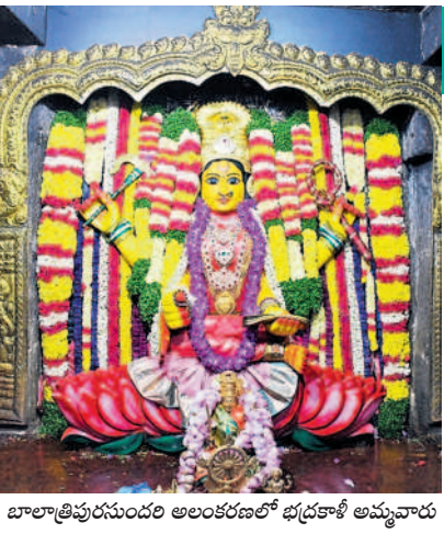
బాలాత్రిపురసుందరి అలంకరణలో భద్రకాళీ అమ్మవారు