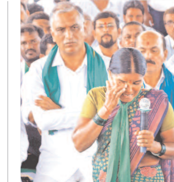
సంగారెడ్డి జిల్లా డప్పుల్లో హాల్ రావు హాజరైన సమావేశంలో కంటకడి పెట్టుకున్న ఫార్మా బాధిత మహిళారైతు

షిమ్లా, ఆక్టోబర్ 3: ఉదాత్తాల పేరుతో ఉదయగోల్డీ హిమాచల్ ప్రదేశ్ లో అధికారంలోకి వచ్చిన కాంగ్రెస్ పార్టీ.. ఇప్పుడు ప్రజలు చెంబట్టు పోయేందుకు కూడా భయపడే పరిస్థితులు తీసుకొచ్చింది. అలవికాని హామీలు అమలు చేసేందుకు ప్రజల నుంచి కొత్త పన్నులు వసూలు చేయాలని నిర్ణయించింది. ఆఖరికి మరుగుదొడ్డిపై పన్ను విధించాలని నిర్ణయం తీసుకున్నది. సాధారణంగా బహిరంగ మల విసర్జనను నిర్మూలించడానికి ప్రభుత్వాల మరుగుదొడ్డి నిర్మాణాన్ని ప్రోత్సహిస్తాయి. మరుగుదొడ్డి నిర్మించుకునేందుకు ప్రజలకు నిధులు మంజూరు