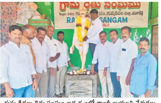
గుమ్మడిదల: రైతు సంఘం ఆధ్వర్యంలో గాంధి జయంతి వేడుకలు