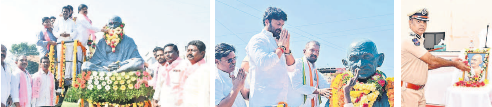
గోదావరిఖని : గాంధీ విగ్రహానికి పూలమాల వేస్తున్న జీఆర్ఎస్ నాయకులు