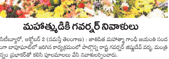
మహాత్ముడికి గవర్నర్ నివాళులు