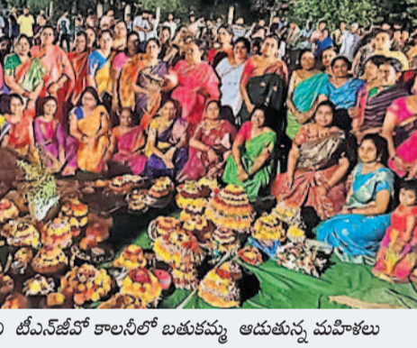
గచ్చిబౌలిలోని టీఎన్ఎస్ఎం కాలనీలో బతుకమ్మ ఆడుతున్న మహిళలు