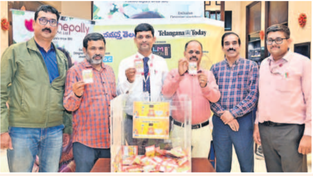
వినయోగదారులతో విజేతల ఎంపిక

హైదరాబాద్, అక్టోబర్ 2 : తెలంగాణ ఇంటి పత్రిక 'నమస్త' మరో సారి గ్రేటర్ వినయోగదారులకు దసరా కానుకలను తీసుకొచ్చింది. నమస్త తెలంగాణ తెలంగాణ టుడే సంయుక్తాధ్యక్షులలో నిర్వహిస్తున్న దసరా షాపింగ్ బొనాంజా గ్రాబ్బు కాల్పాణి కొనసాగుతున్నది. కేవలం ఫ్యాషన్ మాల, బిగిసి, ఆల్బండ్ హాజ్ భాగస్వామ్యం, టీవీ షాఫ్టినర్గా బోనూస్, సుమన్ టీవీ డిజిటల్ పార్ట్స్లోగా దసరా షాపింగ్ బొనాంజా మొదటి డ్రా పంజాగుట్టలో మానేపల్లి జ్యువెల్లర్స్ వేదికగా జరిగింది. బొనాంజాలో మొదటి రోజు ముగ్గురు లక్ష్మీ విజేతలను ఎంపిక చేశారు. విజేతలు మొదటి బహుమతిగా 32 ఇంచుల టెలివిజన్, రెండో బహుమతిగా స్మార్ట్ ఫోన్, మూడో బహుమతిగా గిఫ్ట్ ఓబ్ రిస్ గెల్లుతున్నారు.