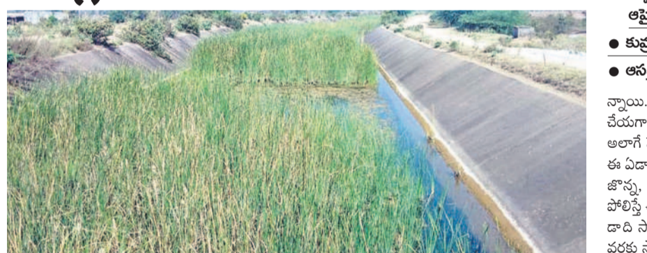
కుటుంబం ప్రాజెక్టు నుంచి నీటి విడుదల చేయకపోవడంతో కాలువల్లో పెరిగిన గడ్డి

కుటుంబం ఆసిఫాబాద్, అక్టోబర్ 1 (నమస్తే తెలంగాణ) : జిల్లాలో కొన్నిక్షణం పెరుగుతూ వచ్చిన యాసంగి సాగు, ఈయోదాది తగ్గముఖం పట్టింది. గంబరూంగి సీజన్లో దాదాపు 43 వేల ఎకరాల్లో వివిధ రకాల పంటలు వేశారు. ఈ యోదాది 40 వేల ఎకరాల్లో సాగు ఉంటుందని అధికారులు భావించినప్పటికీ, 30 వేల ఎకరాల్లోనే పంటలు వేస్తున్నట్లు తెలుస్తున్నది. కేసీఆర్ సర్కారులో 24 గంటల ఉపేక్షా దినోత్సవం, సాగు వనరులతో దర్గా పంటలు తీసిన రైతాంగం, ఈసారి మాత్రం వెనుకడుగు వేస్తున్నారు. ఇప్పటికే జిల్లాలో వ్యవసాయానికి అనధికారిక విద్యుత్ కోతలు మొదలు