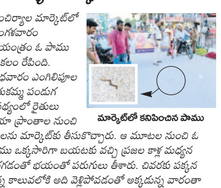
మార్కెట్లో కనిపించిన పాము

మంచిర్యాల మార్కెట్లో మంగళవారం సాయంత్రం ఓ పాము కలకలం రేపింది. బుధవారం ఎంగిలిపూల బతుకమ్మ పండుగ నేపథ్యంలో రైతులు ఆయా ప్రాంతాల నుంచి మార్కెట్లో కనిపించిన పాము పూలు మార్కెట్లో తీసుకోవచ్చు. ఆ మూలం నుంచి ఓ పాము ఒక్కసారిగా బయటకు వచ్చి ప్రజల కాళ్ళ మధ్యన తిరగడంతో భయంతో పరుగులు తీశారు. చివరకు పక్కన ఉన్న కాలువలోకి అది వెళ్లిపోవడంతో ఆకృదాన్ని వారంతా ఊపిరి పీల్చుకున్నారు.