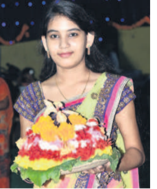
కొత్తపూవుకు ఒక్కో ప్రత్యేకత..

మంచిర్యాల అర్బన్, అక్టోబర్ 1 : పూల పండుగ నేడు వచ్చింది. తెలంగాణ మహిళలు ప్రత్యేకంగా జరుపుకునే పండుగల్లో ప్రాధాన్యమైనది బతుకమ్మ. తెలంగాణ సంస్కృతి సంప్రదాయాలకు ప్రతీకగా ఈ పండుగను జరుపుకోవడం ఆనంబుతీగా వస్తోంది. తెలంగాణ ఆస్తిత్వం బతుకమ్మ పండుగలో ఇమిడి ఉంటుంది. దసరాకు ముందుగా వచ్చే ఈ పండుగను గౌరవించుకుని, సద్దుల పండుగ, పూల పండుగ అని కూడా పిలుస్తారు. మహాలయ అమావాస్య అయిన బుధవారం మొదలయ్యే బతుకమ్మ (ఎంగిలి పూలు) సంబరాలు సద్దులతో ముగుస్తాయి.