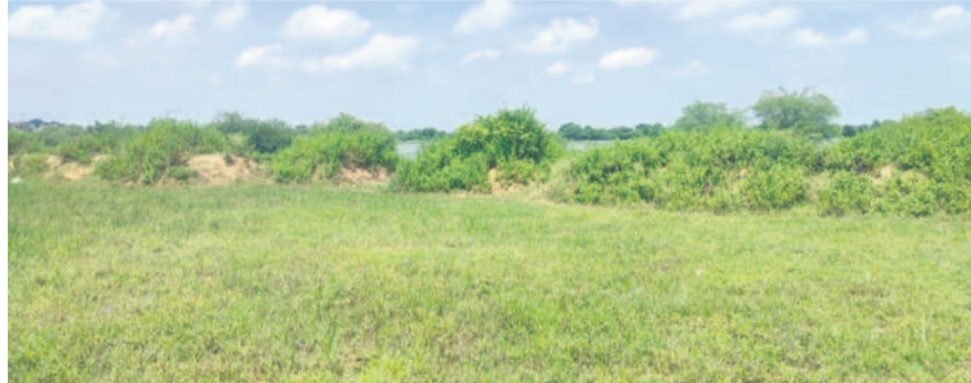
శనిగకుంట ఎఫ్ఓఎల్, బఫర్ జోన్లో పోసిన మట్టి కుప్పలు

మంచిర్యాల, అక్టోబర్ 1 (నమస్తే తెలంగాణ ప్రతినిధి) : జిల్లాలోని చెరువుల ఆక్రమణలపై కొరడా రుగ్మిషిస్తున్న యంత్రాంగం 'శనిగకుంట'పై మాత్రం నిర్లక్ష్యంగా వ్యవహరిస్తున్నది. సర్వే చేసి ఎఫ్ఓఎల్, బఫర్ జోన్లో పోసిన మట్టిని వెంటనే తొలగించాలని ఆయనకు రైతులు, స్థానికులు ఎప్పటి నుంచో వేడుకుంటున్నా, ఎమాత్రం స్పందించకపోవడం విమర్శలకు తావిస్తున్నది.