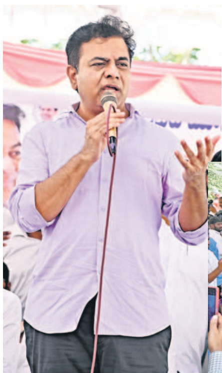
అంబర్పేటలో ఏర్పాటు చేసిన బీఆర్ఎస్ భరోసా సమావేశంలో మాట్లాడుతున్న బీఆర్ఎస్ పార్టీ వర్కర్ల పైసెంటేజ్ కేటీఆర్