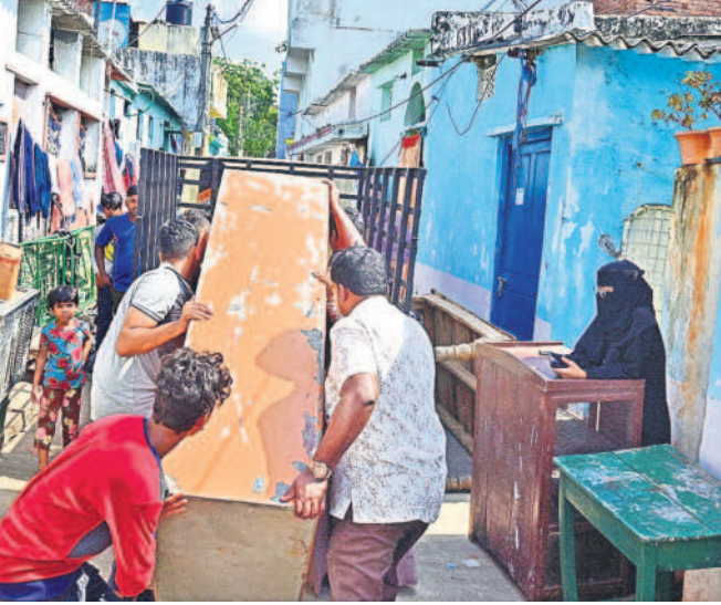
సామగ్రిని తరలిస్తున్న బాధితులు