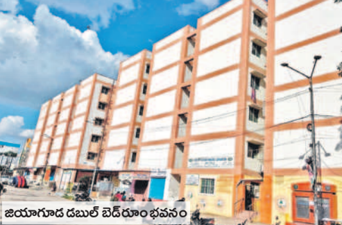
జియోగూడ డబుల్ బెడ్రూం భవనం

జిల్లాలో ఇప్పటి వరకు 163 డబుల్ ఇండ్లు కేటాయింపు వసతులు ఏర్పాటు చేయకుండానే ఇండ్లలోకి తరుముతున్న అధికారులు నిర్వాసితుల ఆగ్రహం