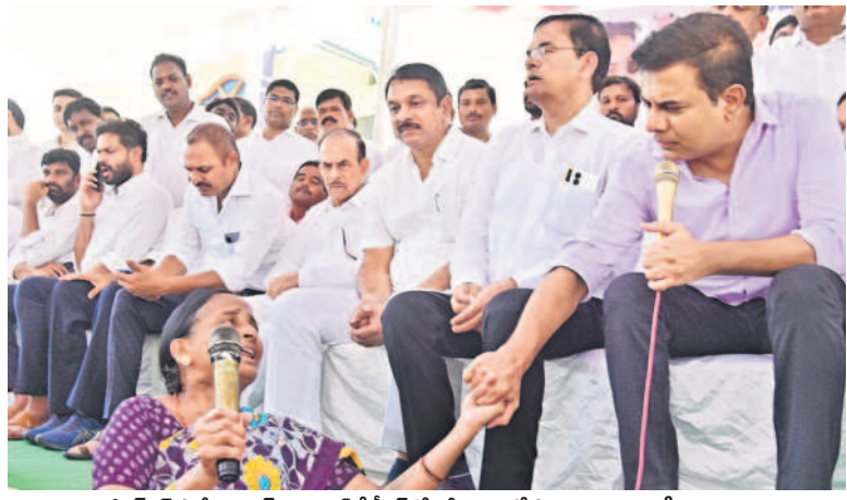
బీఆర్ఎస్ పార్టీ వర్కర్ల పైసెంటేజ్ కేటీఆర్తో గొడు వెళ్లడంనుకుంటున్న మూసీ బాధితురాలు