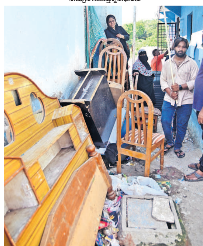
ఫలవర్షన తరలిస్తున్న నిర్వాసితులు