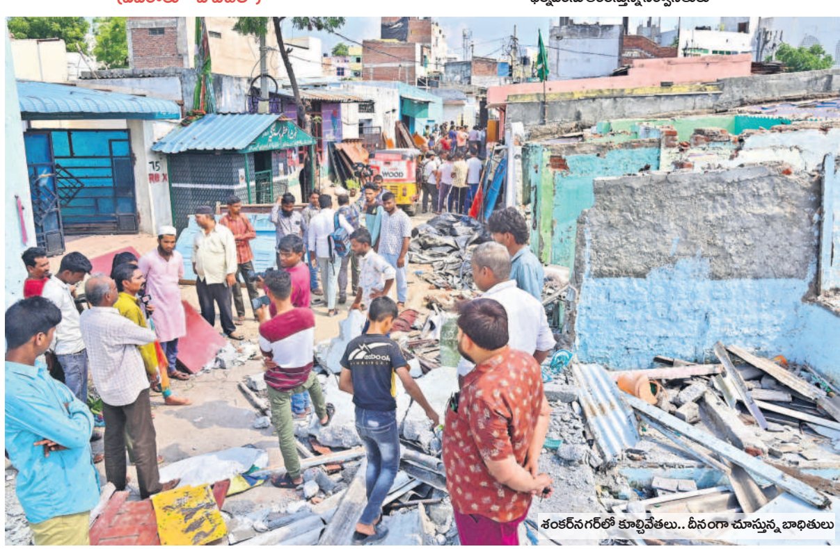
శంకరనగర్లో కూల్చివేతలు.. దీనంగా చూస్తున్న బాధితులు