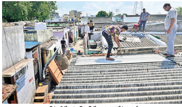
చాంద్రపూడిలోని శంకరనగర్లో ఇండ్లు కూల్చివేస్తున్న కూలీలు

హైదరాబాద్, బుధవారం 2 అక్టోబర్ 2024 HYDERABAD