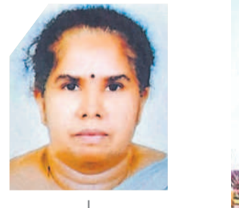
భోజిన్ గారి అనసూయ