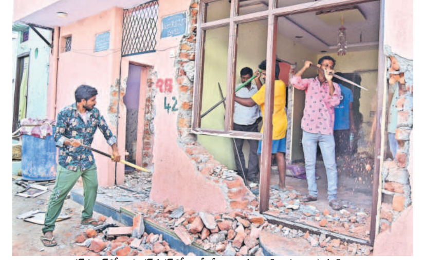
వాడరహాట్ లోని శంకర్ నగర్ లో ఖాళీ చేయించిన ఇంటిని కూల్చుతున్న నిపుంధి

హైదరాబాద్ సీటీబ్యూరో/మలకేష్, అక్టోబర్ 1 (నమస్తే తెలంగాణ): మూసీ నిర్మాణాలకు రోడ్ల సీఎం రేవంత్ రెడ్డి రాతి గుండెను కదిలించలేకపోయింది. అనుకున్నట్లుగానే మూసీ నిర్మాణాలకు నివాసాలను కలిపించి వారి బతుకులను చీకట్లో నెట్టేసి కుట్రకు శ్రీకారం చుట్టింది. అందులో భాగంగా హైదరాబాద్ లో మూసీ పరివాహక ప్రాంతాల్లో రెడ్ మార్క్ చేసిన ఇండ్లను మంగళవారం కూల్చివేశారు. అడగడమైనా బాధితులు అడ్డుకునే ప్రయత్నం చేసినా పోలీసుల హతాశం ఇండ్లను భూస్వామిక చేశారు. హైదరాబాద్ మండలం మూసీ పరివాహక ప్రాంతంలో 150 ఇండ్లను అధికారులు నేలమట్టం చేశారు. కూల్చివేతలు ఇప్పటికీ తీవ్రమైన స్థాయిలో కొనసాగుతున్నాయి. అధికారులు అందుకు మరడంగా మూసీలో కూల్చివేతలు ప్రారంభించి నిర్మాణాల్లో భయాందోళనలు నింపారు. మళ్ళీ ఆ ప్రాంతంలో ఉద్రిక్త వాతావరణాన్ని సృష్టించారు. క్షణక్షణం తమ బతుకులను కోల్పోతున్నారని అనుకున్నారని బాధితులు కంటి మీద కుసుకు లేకుండా గడుపుతున్నారు. ఇప్పటి వరకు అధికారులు 1,595 నిర్మాణాలను రివర్ట్ చేసి గుర్తించారు. ఇందులో 940 ఇండ్లకు ఎక్స్ ప్లొజివ్ చేసినట్లు ఆర్డీవో మహిళ పాల్ తెలిపారు. కాగా, మంగళవారం 150 ఇండ్లను మలకేష్ ఎమ్మెల్యే సమకంఠో కూల్చివేసినట్లు అధికారులు తెలిపారు.