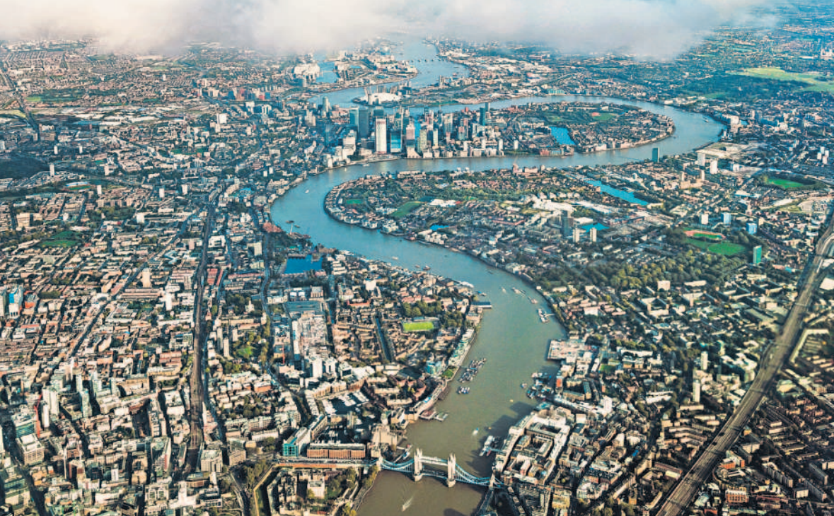
థేమ్స్ నది ఒడ్డున భారీ నిర్మాణాలు, వాణిజ్య సముదాయాలు