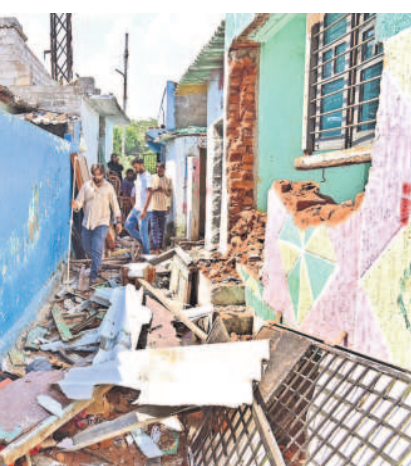
హైదరాబాద్ మండలం వాడరహాట్ లోని శంకర్ నగర్ లో ఖాళీ చేయించిన ఇండ్లను మంగళవారం కూల్చుతున్న నిపుంధి