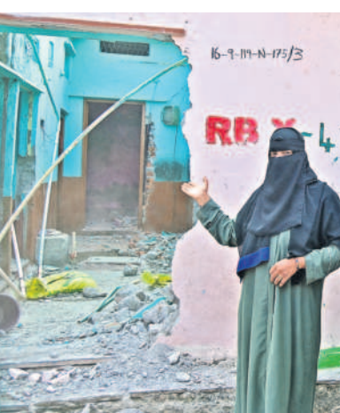
శంకర్ నగర్ లో మంగళవారం అధికారులు కూల్చేసిన తన ఇంటిని చూస్తూ ఆవేదన చెందుతున్న బాధితురాలు