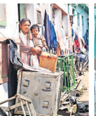
కూల్చివేత నేపథ్యంలో తన ఇంటి నుంచి భయంభయంగా చూస్తున్న మహిళ