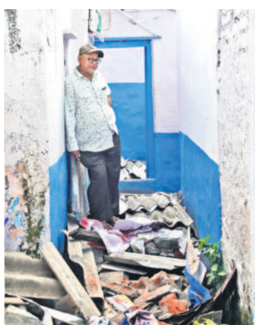
వాడరహాట్ ప్రాంతంలోని శంకర్ నగర్ లో అధికారులు కూల్చిన ఇంట్లో బాధితుడు

థేమ్స్ నది ఒడ్డున కోటికి పైగా ఇండ్లు, ఫ్యాక్టరీలు, వాణిజ్య సముదాయాలు ఉంటాయని అధికారులు అంచనా. అయితే, మురుగునీటి నిర్వహణ పేరిట నిర్మించిన 'సీవర్జీ నెట్ వర్క్' కోసంగానీ, వరదల నియంత్రణ కోసం నిర్మించిన 'థేమ్స్ బ్యారీయర్' కోసంగానీ ఇప్పటివరకూ ఏ ఒక్క నిర్మాణాన్ని కూడా కూల్చలేదని పోర్ట్ అఫ్ లండన్ అధికారి రికార్డులను బట్టి తెలుస్తున్నది. మురుగునీటి కోసం నిర్మించిన సాంగాలను రోడ్డుకు మధ్యలో ఒక మీటరు వెడల్పుతో ఏర్పాటు చేశామని, మురుగునీటి నిర్వహణ ట్యాంకులను ప్రభుత్వానికి చెందిన బాకీ ప్రదేశంలో నిర్మించినట్లు అధికారులు తెలిపారు. వరదల నియంత్రణకు తీసుకొచ్చిన 'థేమ్స్ బ్యారీయర్' ను నది మధ్యలో నిర్మించేట్లు వివరించారు. ఇక, ఇండ్లలో ఉండే ప్రజలకు, వాణిజ్య కార్యకలాపాలకు ఇబ్బందులు ఎదురవుతున్నాడని తెలిపారు. సెలవు దినాల్లోనే ఈ పనులను చేపట్టామని, ప్రజలను ఎక్కడికీ తరలించలేదని వివరించారు.