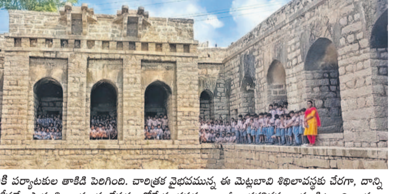
నాగన్నబాబికి పర్యటకుల తాకిడి పెరిగింది. వారితో ప్రభుత్వం ఈ మెట్టబావి శిథిలంపనుల చేరగా, దాన్ని పునరుద్ధరించి ఇటీవలే ప్రారంభించారు. ఈ నేపథ్యంలోనే సందర్భులు భారీగా తరలివస్తున్నాయి. విట్లం విద్యార్థులు బావిని సందర్శించారు.