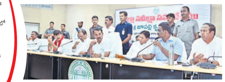
సమావేశంలో మాట్లాడుతున్న మంత్రి జూపల్లి కృష్ణారావు

పనితీరు మెరుగుపరుస్తూ రూ.2 లక్షల రుణమాఫీ చేస్తూ పాలిటెక్నిక్ కాలేజీ 'ఇంజనీరింగ్ అండ్ గ్రేడ్ మంత్రి జూపల్లి కృష్ణారావు వెల్లడి