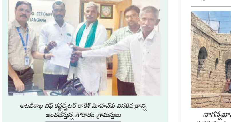
అటవీశాఖ చీఫ్ కన్వెన్షన్ల రాకే మోహన్ వినతిపత్రాన్ని అందజేస్తున్న గౌరారం గ్రామస్థులు

గాంధారి, సెప్టెంబర్ 30: ఆక్రమణకు గురైన అటవీ భూములను కాపాడాలని గాంధారి మండలం గౌరారం గ్రామస్థులు చీఫ్ కన్వెన్షన్ల అఫ్ ఫార్స్ట్ (సీసీఎఫ్) రాకే మోహన్ డొక్యుమెంట్ విస్తయించారు. ఈ మేరకు హైదరాబాద్ లోని సీసీఎఫ్ కార్యాలయంలో ఆయనను కలిసే వినతిపత్రం సమర్పించారు. గ్రామ శివారులోని అటవీ భూమిని కొందరు ఆక్రమించారని ఆయన దృష్టికి తీసుకొచ్చారు. దాదాపు 150 ఎకరాలను ఆక్రమించి పంటలు సాగు చేస్తున్నట్లు వివరించారు. తమ గ్రామశివారులోని అటవీ భూమి సర్వే చేసి, హద్దులు ఏర్పాటు చేయడం ద్వారా భూములను కాపాడాలని విజ్ఞప్తి చేశారు. ఆక్రమణలపై డివైఎఫ్ కు విస్తయించినా ఎలాంటి చర్యలు తీసుకోలేదన్నారు. తమ విజ్ఞప్తి సీసీఎఫ్ సానుకూలంగా స్పందించారని, సర్వే చేసి హద్దులు ఏర్పాటు చేస్తామని చెప్పారని గౌరారం గ్రామస్థులు తెలిపారు.