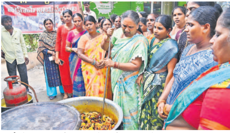
మూసీ పరివాహక ప్రాంతంలోని న్యూ మారుతీనగర్లో పంటావార్డుతో నిరసన తెలుపుతున్న నిర్వాసితులు