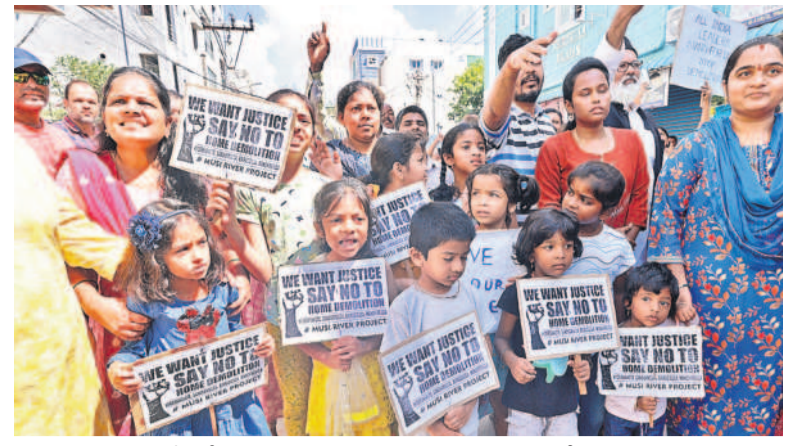
హైదరాబాద్లో మా ఇండ్లను కూల్చివేయడం... ప్రభుత్వానికి విజ్ఞప్తి చేస్తున్న చిన్నారులు

I హైదరాబాద్, సోమవారం 30 సెప్టెంబర్ 2024 VIKARABAD