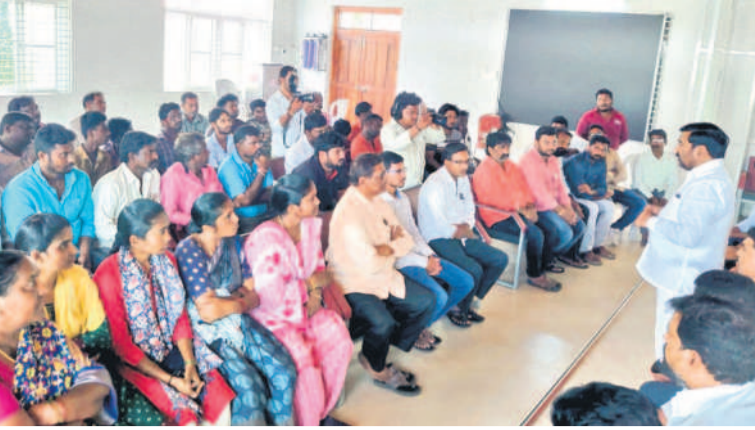
శ్యాంపు కార్యాలయాలకి వచ్చిన బాధితులకు కుటుంబాలను ఉద్ధరించే మార్గంపై చర్చించారు. మాజీ మంత్రి, ఎమ్మెల్యే గుంటకండ్ల జగదీశ్ రెడ్డి