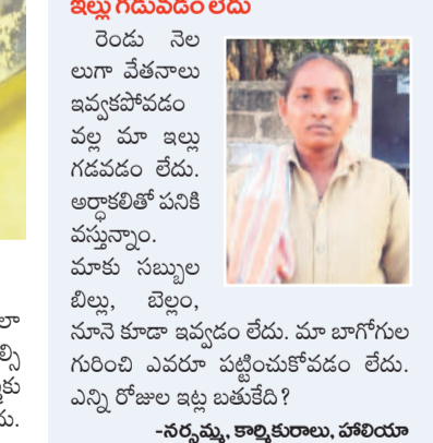
ఇల్లు గడువడం లేదు