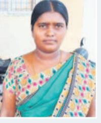
నందిగామ యేనుకాణి, కూచిపూడి, కోడదా మండలం

నా ఇల్లు ఊర్లోని అంతర్గంగా వాగు సమీపంలో ఉండడంతో వరద ఇంటిని ముంచెత్తినది. మా ఇంటిలోని సామాన్యతోపాటు ద్వైతరవాసం సైట్లో కొట్టుకుని పోయాయి. అధికారులు నాకు రేషన్ కార్డు లేదని బాధితుల జాబితాలో పేరు రాదులేమని చెప్పారు. ప్రభుత్వం ఇచ్చిన వరద సాయం లేకపోగా నిత్యావసర సరుకులు సైతం ఇవ్వలేదు. ఇప్పటికైనా పత్రాలు, రేషన్ కార్డులు కాకుండా బాధితులకు న్యాయం చేయాలి.