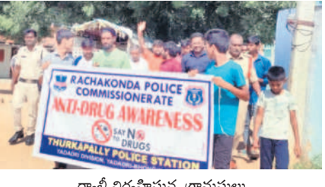
ర్యాల్ నిర్వహిస్తున్న గ్రామస్థాయి

తుర్కపల్లి, సెప్టెంబర్ 29 : గ్రామంలో మద్యం అమ్మకాలు నిషేధించాలని మండలంలోని సంగమం గ్రామస్థాయి అధికారి తీర్మానించారు. దీనిని అతిక్రమించి ఎవరైనా మద్యం విక్రయిస్తే లక్ష రూపాయల జరిమానా చెల్లించాలని నిర్ణయించి గ్రామంలో రాళ్ళి నిర్వహించారు. ఈ సందర్భంగా గ్రామ పెద్దలు మాట్లాడుతూ తండ్రాలో విచ్చలవిడిగా మద్యం విక్రయిస్తుండడంతో గ్రామ ప్రజలతోపాటు యువత మద్యానికి బానిస అవుతున్నారన్నారు. దాంతో ఆర్థిక కంగా వెనుబడిపోయి కుటుంబాలు విచ్ఛేదనం పాలై యని వేరొన్నారు. ఎవరైనా నిబంధనలు అతిక్రమించి మద్యం విక్రయిస్తే రూ.లక్ష జరిమానా విధిస్తామని తీర్మానంలో వేరొన్నారు. కార్యక్రమంలో పాల్గొన్న సులు, గ్రామ యువత పాల్గొన్నారు.