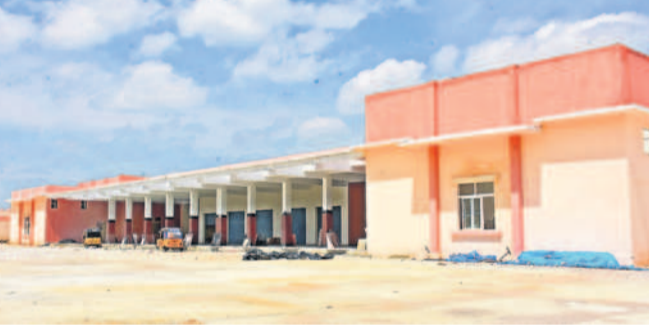
కొండకింద సూతన దేవస్థాన బస్సు ప్రాంగణం

యాదగిరిగుట్ట, సెప్టెంబర్ 29 : యాదగిరి గుట్ట లక్ష్మీనరసింహ స్వామివారి కొండపైకి బస్సు వెళ్లేందుకు భక్తుల కోసం ప్రత్యేక దేవస్థాన బస్సు ప్రాంగణం నిర్మిస్తున్నారు. స్వామివారి ఆలయ పునర్నిర్మాణంలో భాగంగా కొండకింద బస్టాండ్ పక్కనే దేవస్థానం ఆధ్వర్యంలో బస్సు దీనిని నిర్మిస్తుండగా ఇప్పటికే 85 శాతం పనులు పూర్తయ్యాయి. మిగతావి పురోగతిలో ఉన్నాయి. ప్రైవేట్ డీఎ. 8.79 కోట్లతో 2 ఎకరాల్లో నిర్మించే బస్టాండ్లో 10 ఫ్లోటింగ్ మోటార్లు, 2 లీకేజీ కౌంటర్లు, 2 ఏటీఎం సింబులు, 5 ప్యాపర్లు, క్లాక్ రూమ్, ఎగ్జిట్ లాబీ, కామన్ వెయిటింగ్ ఏరియా, స్ట్రీటు, పురుషులకు ప్రత్యేక