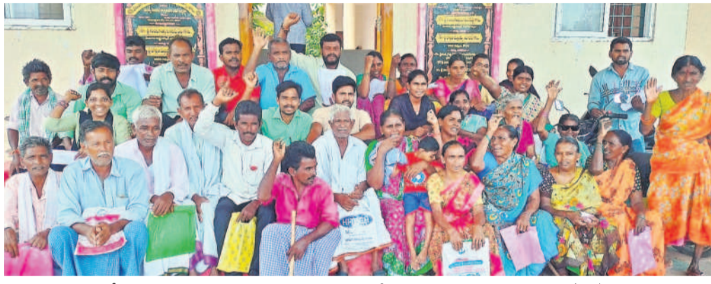
కోడదా ఆర్థిక కార్యాలయం ఎదురు నిరసన వ్యక్తం చేస్తున్న కూచిపూడి వరద బాధితులు (ఫైల్)

కోడదా పట్టణంలో సైతం వరద ఇండ్లను ముంచెత్తడంతో ఎంతో మంది నష్టపోయారు. పైఅంతస్తులో బిక్కుబిక్కుమందిగా ప్రాణాలు అలవేరితే పట్టుకుని గడిపారు. కొందరు లైట్ బోర్డు సహాయంతో బయటపడ్డారు. కానీ అలాంటి వారికి సాయం అంద