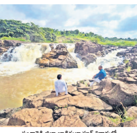
సంగారెడ్డి జిల్లా జాడిమల్యాపూర్ శివారులో పరవళ్లు తోకతున్న జలపాతం

సంగారెడ్డి జిల్లా యంత్రాంగం కృషిచేయడం లేదు. పెద్ద వారు ప్రాజెక్టు నిర్మాణానికి అనుకూలంగా ఉన్నా, పాల కుటుంబ శ్రద్ధ చూపడం లేదు. పెద్దవారు ఇచ్చేవులా కోండల ఉండడంతో ప్రాజెక్టు నిర్మాణం, ఎత్తిపోతల ద్వారా పాల లకు సాగునీటిని అందించే రైతులు చెబుతున్నారు. ఎత్తిపోతల పథకం నిర్మాణం మొగుడంపల్లి మండలంలోని జాడిమల్యాపూర్ జిల్లా జూబిలాబాద్ నియోజకవర్గం కోహిల్ మండలంలోని గోటిగిరిపల్లి గ్రామం శివారులో పెద్దవారు ప్రాజెక్టు పర్యాటకంలో కుర్రని భారీ వరాలకు నిండుతుంది. దీంతో ఈ ప్రాజెక్టు నుంచి దిగువకు వెళ్తున్న వడ జూబిలాబాద్, మొగుడంపల్లి మండలంలోని మల్లపల్లి, జాడిమల్యాపూర్, సజ్జరాపుపేట తదితర గ్రామాల మీదుగా కర్ణాటకకు తరలిపోతున్నది. కర్ణాటకలోని గుర్రబల్లా జిల్లాలోని చింతోళి తాలూకా పరిధిలోని బీమానది తీరంలో 1973లో చండ్రంపల్లి ప్రాజెక్టు నిర్మాణం నిర్మించారు. ఈ ప్రాజెక్టుకు మొగుడంపల్లి వద్ద వృధాగా పోతున్నా ప్రాంతానికి సాగు, తాగునీటి అవసరాలు తీరుతున్నాయి. కానీ, వృధాగా పోతున్న ఈ నీటిని సద్వినియోగం చేసుకునే దిశలో