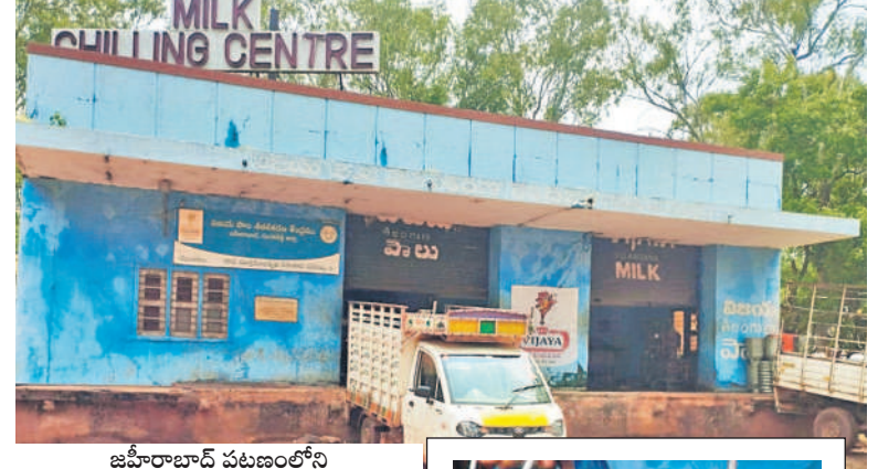
జూబిలాబాద్ పట్టణంలోని విజయ డెయిరీ పాలసేకరణ కేంద్రం