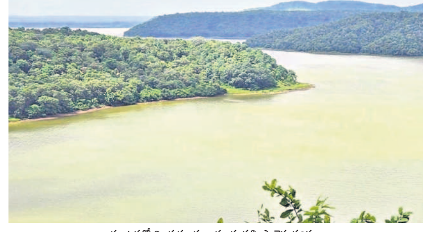
కర్ణాటకలో నిండుకుండలా చండ్రంపల్లి ప్రాజెక్టు పరిసరాలు