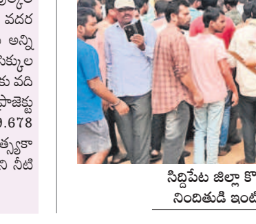
సిద్దిపేట జిల్లా కొమురవెల్లి మండలం గురువన్నపేటలో నింటుడి ఇంటి వద్ద ఆందోళన చేస్తున్న గ్రామస్థులు