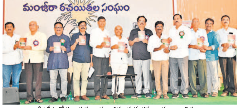
సిద్దిపేటలో పలు పుస్తకాలను అవిష్కరిస్తున్న అధ్యక్షుడు, ముఖ్య అతిథులు