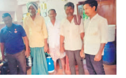
సంగారెడ్డి జిల్లా మామిడి గ్రామంలోని పాలసేకరణ కేంద్రంలో పాలపోసిన రైతులు

రూ.1.75 కోట్లకు పేరుకుపోయిన బకాయిలు సంగారెడ్డి జిల్లాలో విజయ డెయిరీ రైతులకు రూ.1.75 కోట్లపైగానే డబ్బులు బకాయిపడింది. బకాయి డబ్బులు రాక పాడి రైతులు తీవ్ర ఇబ్బందులు