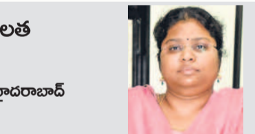
మల్లవరపు బాలలత్ నివిల్ స్వాశక్తి నీఎస్ఐఐఎస్ లకాడమి, హైదరాబాద్