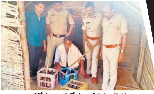
పోలీసుల దాడుల్లో పట్టుబడిన కల్లు (ఫైల్)