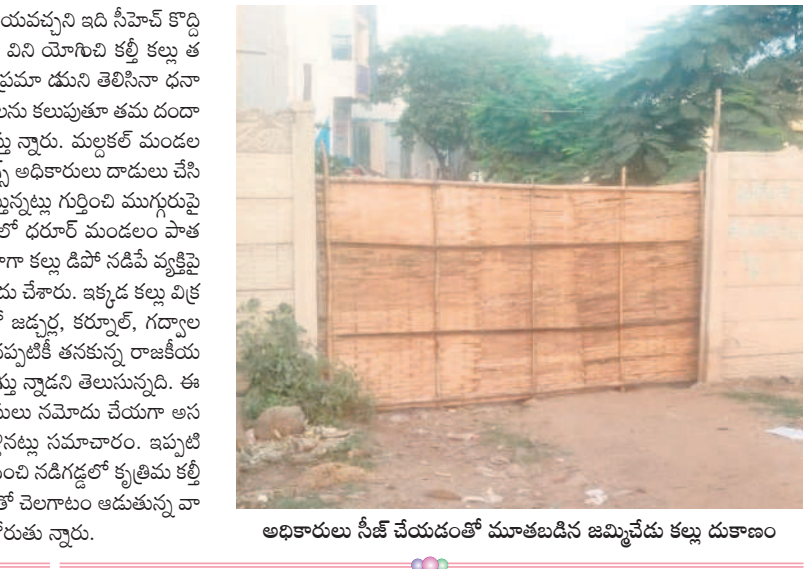
అధికారులు సీల్ చేయడంతో మూతబడిన జమ్మిచేదు కల్లు దుకాణం

ప్రజల ఆరోగ్యంతో చెలగాటం.. కొన్నోండ నుంచి రాజకీయ అందడంకలతో నడిగడ్డలో కృత్రిమ కల్లు తయారు చేసే అమా యత ప్రజల ప్రాణాలతో కల్లు తయారీ దారులు చెలగాటం వేస్తున్నారు. కల్లికల్లు తయారీ దారులు మాత్రం రూ.కోట్లకు పడగలెత్తుతున్నారు. కల్లు తాగిన వారు మాత్రం తమ ఇల్లు గుల్ల చేసుకుంటున్నారు. ఈ విషయం అబ్బూరిశాఖ అధికారులకు తెలిసినా ఏమీ చేయలేని పరిస్థితి నెలకొన్నది. ప్రభుత్వం డ్రగ్స్ వాడకంపై కఠినంగా వ్యవహరిస్తుండడంతో నిషేధిత మత్తు మందుల సరఫరాదారుల వివరాలు బహిష్కరణం అవుతున్నాయి. జూలైలో హైదరాబాద్ లో ఓ వ్యక్తిని అదుపులోకి తీసుకొని ప్రశ్నించడంతో గద్వాలలో కూడా మత్తు పదార్థాలతో కల్లి కల్లు విక్రయిస్తున్నారని గుర్తించి దాడులు చేసినట్లు తెలుస్తున్నది. సాధారణంగా కల్లు తయారీకి సీహెచ్ఎస్ విని యోగిస్తారు. ప్రస్తుతం దీనిపై నిషేధం ఉన్నది. ఒక కిలో సీహెచ్ఎస్ 3 నుంచి నాలుగు కేసుల కల్లు తయారు చేసే దుకు వీలు ఉంటుంది. కానీ అధికారుల దాడుల్లో బయట పడుతున్న నిషేధిత మత్తు మందు ఒక గ్రాముతో 35