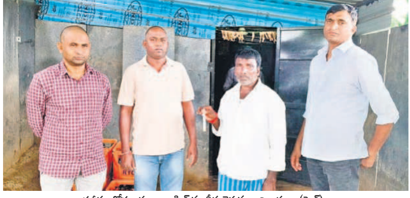
పరిశోధన కోసం కల్లు శాంపిల్స్ను తీసుకెళ్తున్న అధికారులు (ఫైల్)

గద్వాలలో కల్లి కల్లు తయారీ దారులపై నార్కోటిక్ అధికారులు నిఘా ఉంచారు. ఈ నెల 27న గద్వాల నియో జవగ్రాంట్లోని గద్వాల మండలం జమ్మిచేదు, వీరా పురం, మేల చెర్లూ పూడూరు, మల్లకర్ల మండలంలో ఏక కాలంలో నార్కోటిక్ అధికారులు పోలీసుల సహకారంతో కల్లు దుకాణాలపై దాడులు నిర్వహించారు. అక్కడ కల్లు విక్రయిస్తున్న వారు నుంచి సమాచారం సేకరించి వైద్య పరీక్షలు నిర్వహించారు. అయితే ఆయా గ్రామాల్లో విక్రయంతో కల్లు నిషేధిత మత్తు పదార్థాలు కలిపినట్లు గుర్తించారు. దీంతో ఆయా కల్లు దుకాణాల్లో 200 సీసాల నిషేధిత కల్లు సీసాలను స్వాధీనం చేసుకొని నిషేధిత మత్తు పదార్థాలు కలిపి కల్లు విక్రయిస్తున్న 20 మందిపై ఎన్డీఎస్ఎస్ (నా రోడ్డుకి డ్రగ్స్ క్రాక్ ఫిక్ పదార్థాల చట్టం) కింద కేసులు నమోదు చేశారు. ఈ దాడుల్లో రూ.15,600 నగదును కూడా అధికారులు స్వాధీనం చేసుకున్నారు.