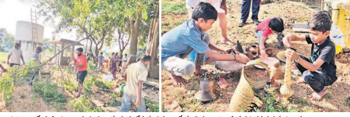
మిట్ట అంజనేయ స్వామి ఆలయ పరిసరాలను శుభ్రం చేస్తున్న సభ్యులు, మేము సైతం అంటూ సామగ్రిని కడుగుతున్న చిన్నారులు