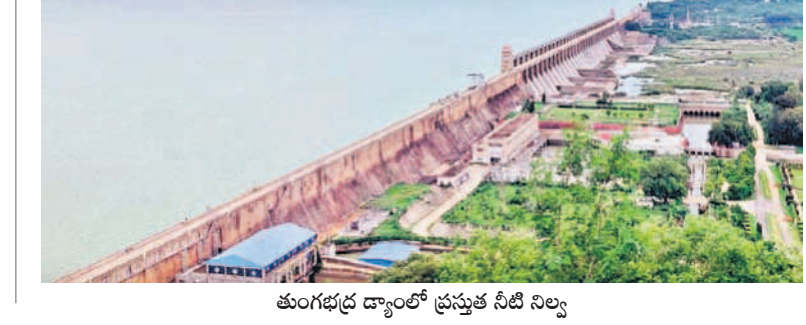
తుంగభద్ర డ్యాంలో ప్రస్తుత సీటిమెంట్