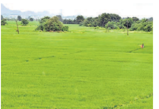
నాగర్ కర్నూల్లో సాగునీటి వనం

నాగర్ కర్నూల్, సెప్టెంబర్ 29 (సమస్తే తెలంగాణ) : రైతుకు భరోసా ఇచ్చే చేయి కనిపించే జేసీ లేదు. టీఆర్ఎస్ ప్రభుత్వం వానకాలం, యాసంగి సీజన్లలో పెట్టుబడుల కోసం రైతులను ఇబ్బందులు పడకుండా అమలు చేసిన రైతు బంధు పథకం పేరు మారినట్లు తప్పక ఆచరణలో చేయాలని అందించే జేసీ లేదు. ప్రస్తుతం వానకాలం పంట సీజన్ కూడా ముగిసింది. యాసంగి దగ్గరికి వచ్చింది. దీంతో ఈ సీజన్లోనైనా రైతు భరోసా అందుతుందా అనే సందేహం రైతుల్లో నెలకొంది. రైతులకు పెట్టుబడుల సాయం ఎండమావీగా మారింది. సమైక్య పాలనలో వ్యవసాయం బండగలా మారితే టీఆర్ఎస్ హయాంలో తొలి సీసం కేసీఆర్ నాయకత్వం పండుగలా మారింది. రైతులకు 24 గంటల ఉచిత విద్యుత్, వెండింగ్ ప్రాజెక్టుల పూర్తి, రైతులకు రూ. లక్షల వరకు రుణమాఫీ, కొనుగోలు కేంద్రాల్లో మద్దతు ధర లాభి వన్నీ చర్యలతో నాటి టీఆర్ఎస్ ప్రభుత్వం