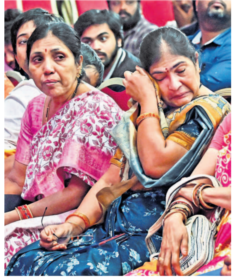
తెలంగాణ భవన్లో గోడు చెప్పకాని కన్నీరుమున్నీరుగా విలపిస్తున్న బాధితులు