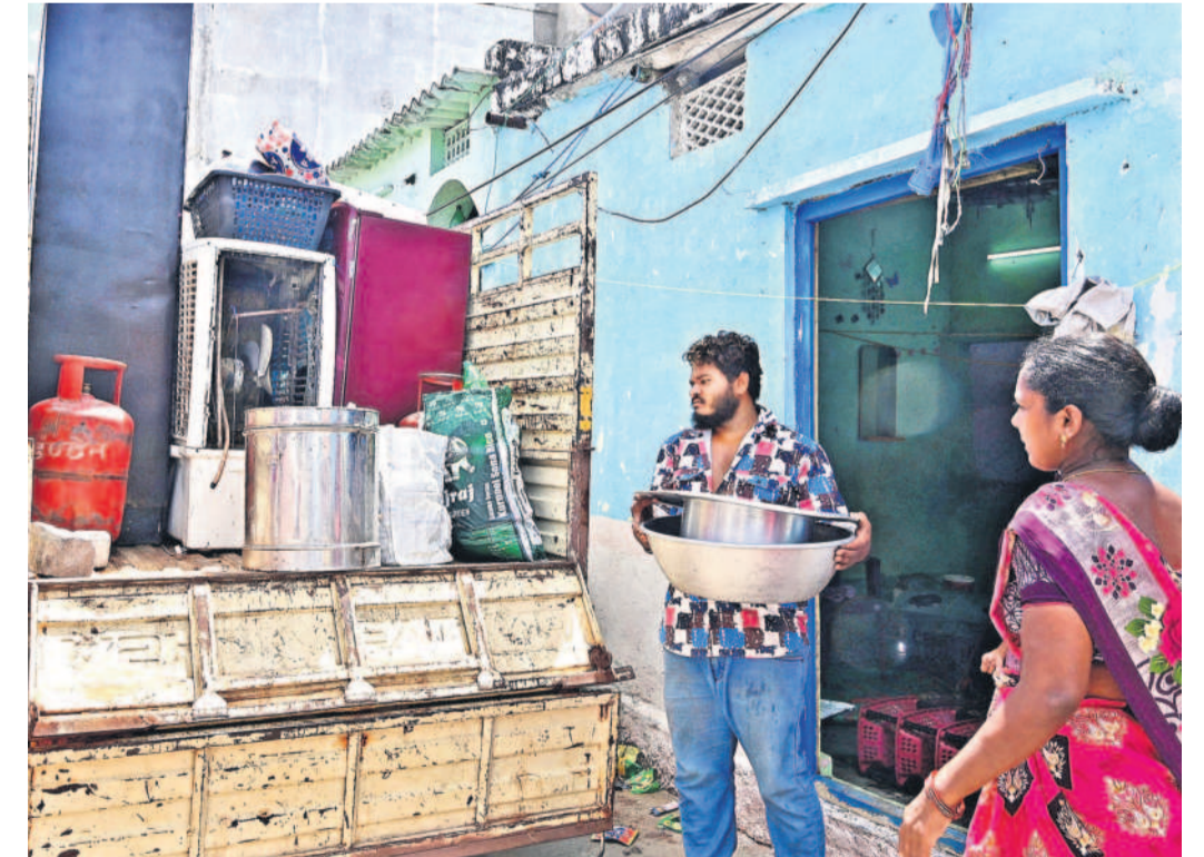
శంకర్ నగర్ నుంచి ఇండ్లు ఖాళీ చేసి తరలివెళ్తున్న నిర్వాసితులు