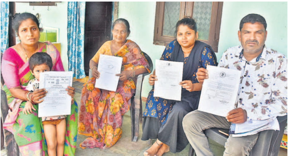
తమ ఇంటి లభిస్తున్న పత్రాలను చూచిస్తున్న హైదరాబాద్ కుటుంబానికి సర్టిఫికేట్లను పంపిస్తున్న నగర అధికారులు

ఈ నాగరికత స్థానిక వ్యవసాయ సమాజాల వల్ల ఏర్పడ్డదనే అభిప్రాయం బలపడుతున్నది. పాలక వ్యవస్థకు నిదర్శనం. మట్టి ఇటుకలతో కట్టిన ఇళ్లు పసారాలతో, స్నానాల గదులతో బయటపడ్డాయి. మురికి కాలువలకు అనుసం