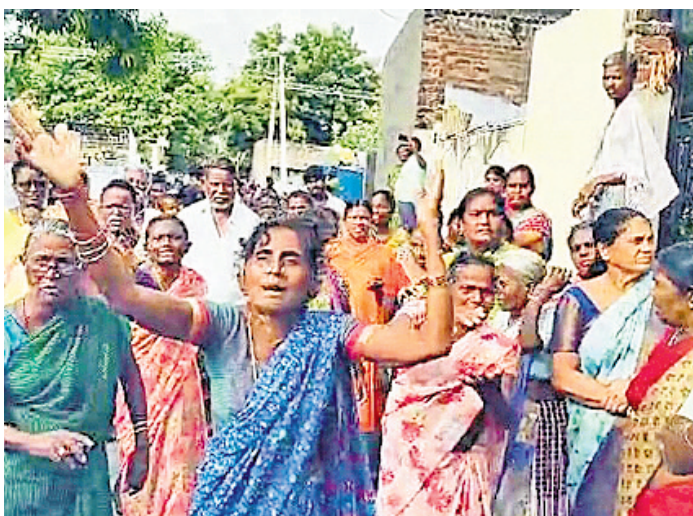
వైపరీత్యాల విధ్వంసానికి కారణమవుతున్న ప్రభుత్వ ప్రవర్తనను తీరు అక్కంత ప్రమాదకరంగా ఉన్నది.

కానీ, దురదృష్టవశాత్తూ రాష్ట్ర కాంగ్రెస్ సర్కార్ కేవలం తన దూకుడు, కుల సమీకరణాల వల్లనే అధికారంలోకి వచ్చామనే అపోహతో అపరాధపూరితంగా వ్యవహరిస్తూ రాష్ట్రానికి, పేద, మధ్యతరగతి బడుగు జీవులకు ఎనలేని నష్టాన్ని కలిగిస్తున్నది. యూపీ, గుజరాత్, అసోం తదితర బీజేపీ పాలిత బులోజర్ పద్ధతులను అవలంబించి అతి తక్కువ కాలంలోనే సుదీర్ఘకాలంగా కాంగ్రెస్ ఓటు బ్యాంకుగా ఉండిన దేశీక, బహుజన, మైనారిటీ వర్గాల అక్రమ అక్రమాలను ఎదుర్కొంటున్నది.