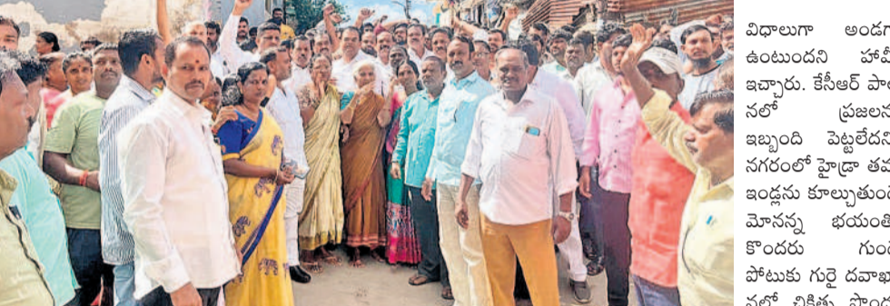
మూసీ నివాసీతులతో మాట్లాడుతున్న ఎమ్మెల్యే కాలేరు వెంకటేశ్

● పేదల జీవితాలతో సీఎం రేవంత్ రెడ్డి చెలాటం ● గోల్కాడ్ మూసీ నివాసీతులకు ఎమ్మెల్యే భరోసా