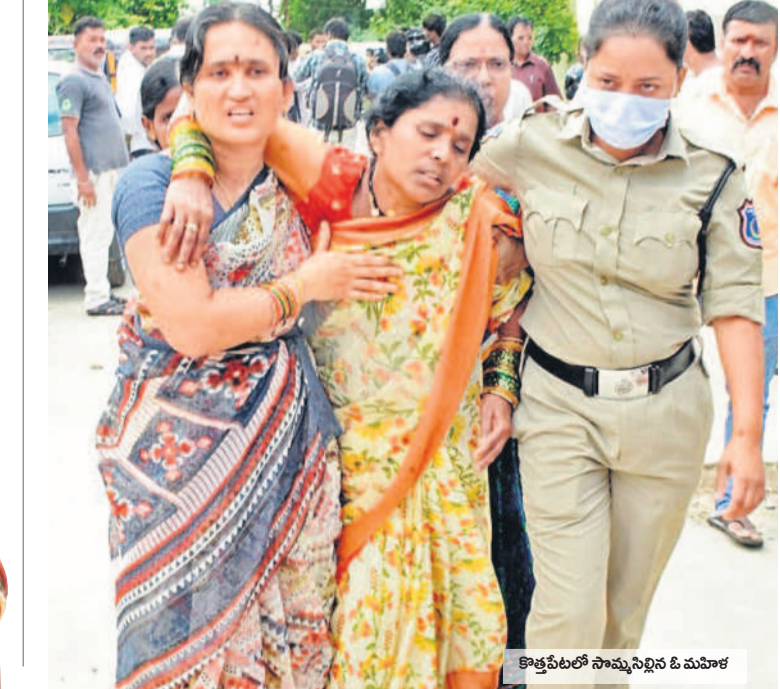
కొత్తపేటలో సామ్యునిస్టన్ ఓ మహిళ