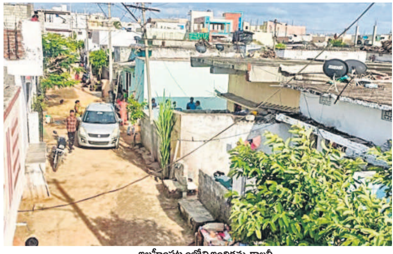
ఇబ్రహీంపట్నంలోని ఇందిరమ్మ కాలనీ