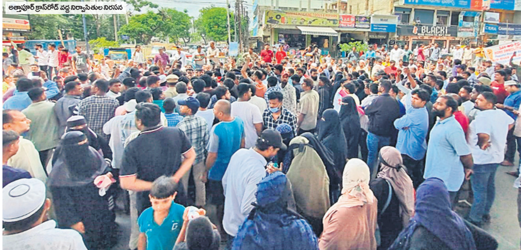
అత్తాపూర్ క్రాస్ రోడ్ వద్ద నిర్యాసితుల నిరసన