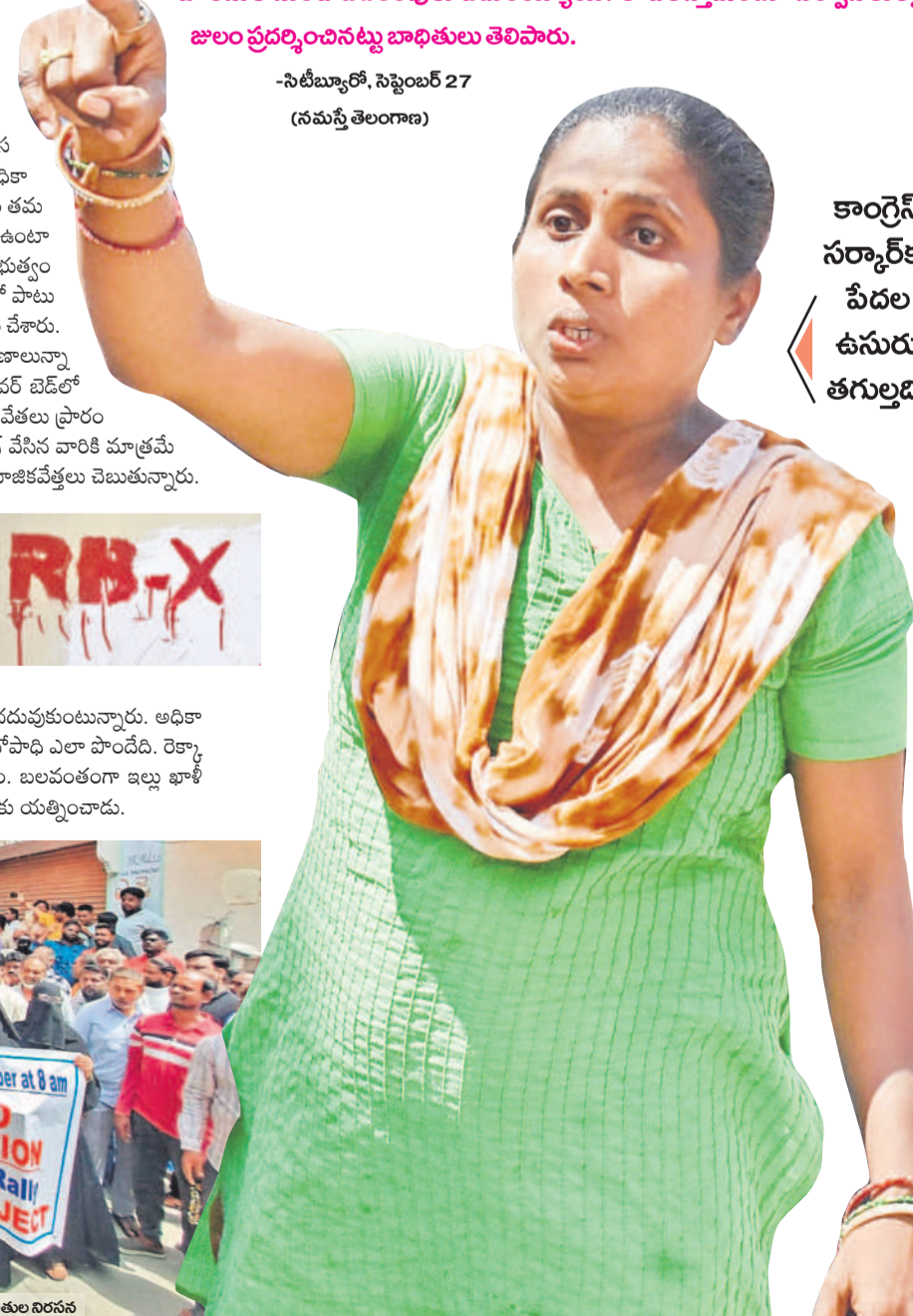
-సిటీబ్యూరో, సెప్టెంబర్ 27 (నమస్తే తెలంగాణ)

కాంగ్రెస్ సర్కార్ కు పేదల ఉసురు తగుల్చి!