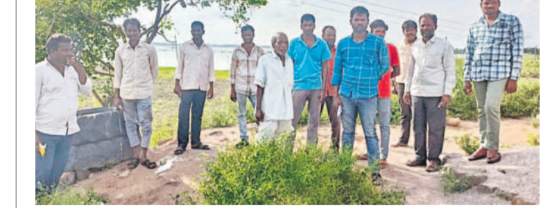
భయం గుప్పిట్లో బిక్కు.. బిక్కుమంటూ గడుపుతున్న కాలనీవాసులు

నగరానికి పరిమితమైన హైద్రా మొట్టమొదటిసారిగా ఇబ్రహీంపట్నం