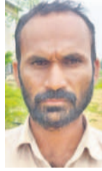
-యాదగిరి, రైతు, కేతవల్లి, పానగల్ మండలం

నాకున్న మూడెకరాల మెట్ట పొలంలో మామిడితోటనుంచి చుక్కాన్నాన్ని.. స్ప్రింక్లర్ కోసం మినీపల్లో దరఖాస్తు చేసుకున్నా. రూ.7 వేలు డీడీ చెల్లింపి సంబంధిత పత్రాలను పోస్టాఫీసుకు రిజిస్టర్ చేసి ఫిజికల్ ఫైల్ లో ఉంచాను. కాంగ్రెస్ ప్రభుత్వం రైతులకు అనుకూలంగా ఉండాలి. పనితీరు అడిగితే అప్పటికే పనికి వచ్చే స్ప్రింక్లర్లు రాబోయే రోజుల్లో అందించాలని కోరుకుంటున్నా. ప్రభుత్వం ప్రజాసేవకు అడుగులు వేయాలి. ప్రభుత్వం ప్రజాసేవకు అడుగులు వేయాలి. ప్రభుత్వం ప్రజాసేవకు అడుగులు వేయాలి.