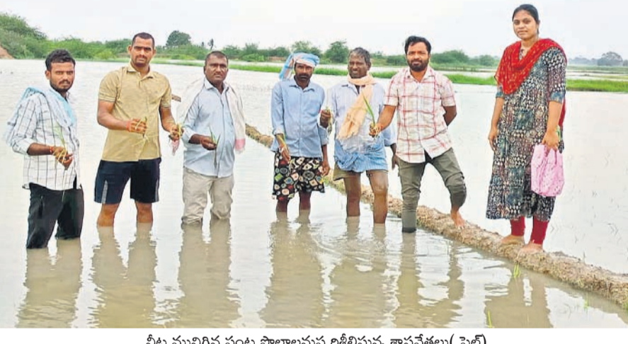
నీటి మునిగిన పంట పొలాలను పరిశీలిస్తున్న శాస్త్రవేత్తలు (ఫైల్)

టీచర్లను నియమించాలి టీచర్లను నియమించాలి టీచర్లను నియమించాలి టీచర్లను నియమించాలి