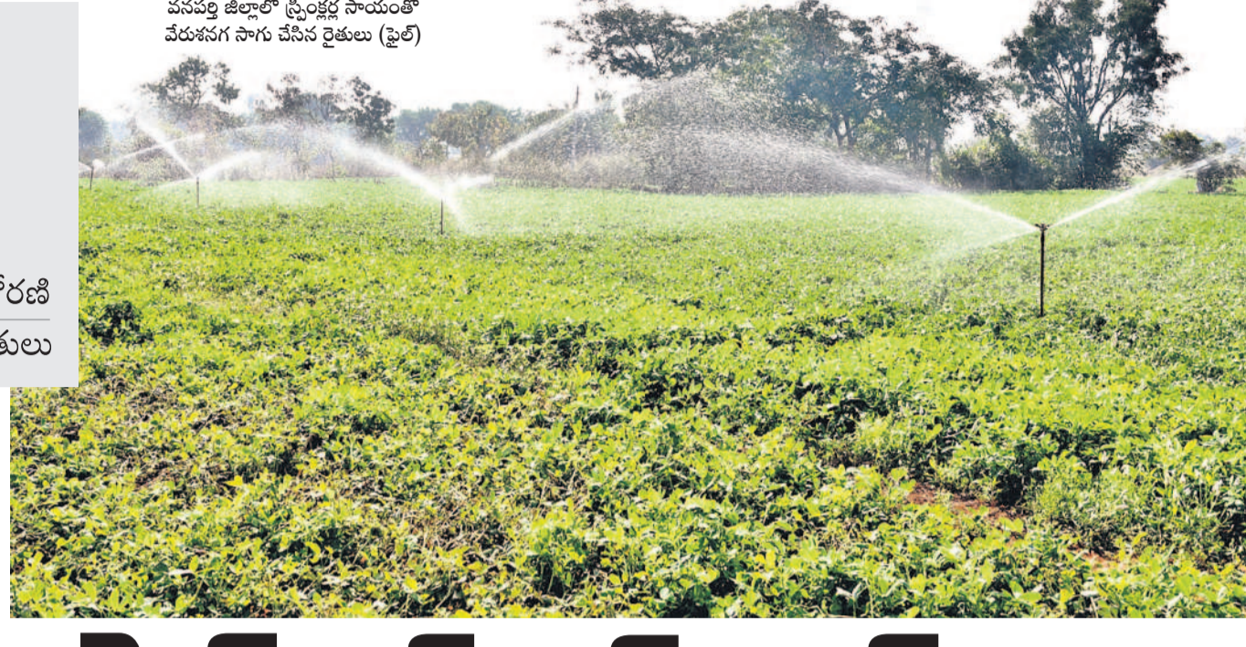
వనపర్తి జిల్లాలో స్ప్రింక్లర్ సాయంతో వేరుశనగ సాగు చేసిన రైతులు (ఫైల్)