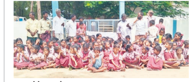
టీటీడోడి ఎంపీఎస్ఎస్ఎస్ ఎదుట విద్యార్థుల నిరసన తెలిపారు.

నాలుగు నెలలుగా నాన్నడు.. ప్రస్తుతం రైతులు వ్యవసాయ సీజన్లో బిజీగా ఉన్నారు. ఇప్పటి వరకు వానకాల సీజన్లో వర్షాలు సమృద్ధిగా కురిశాయి. ఇక.. ఇప్పటి నుంచి మోటర్లు, స్ప్రింక్లర్లు, డిమ్లర్లనే ఎక్కువగా ఆధారపడి రెండింటి పంట సాగులు చేపట్టాలి. ఈ సీజన్ కోసం రైతులకు రెండేండ్ల నుంచి స్ప్రింక్లర్ కోసం డీడీలు కట్టుకున్నారు. ఎంతో ఆశతో ఎదురుచూసిన రైతులకు అప్పుడే అడియోకర్లకు నాన్నడు 162 యూనిట్లను గత జూన్ నెలలో ప్రభుత్వం మంజూరు చేసింది. దాదాపు నాలుగు నెలలుగా ఈ యూనిట్ల కార్యాలయంలోనే మగ్గుతున్నాయి. కొద్దిమేర మంజూరైన యూనిట్లను పంపిణీ చేయలేక నాలుగు నెలలుగా అధికారులు నాన్నడుతున్నారు. దరఖాస్తులు చేసిన రైతుల సంగతి అటుంచి, కేసీఆర్ డీడీలు కట్టిన రైతులైనా యూనిట్లను అందించలేక నీరు దుర్బితా ఉన్నది. ఇదిలా ఉంటే.. 400మంది రైతులు నాన్నడుకుంటూ డీడీలు ఇచ్చిన వారుంటే, అప్రకారంగా స్ప్రింక్లర్ల సరఫరా చేసే కంపెనీ ఏదీ ఉన్నదే గానీ కూడా పనితీరు అడిగితే అప్పటికే పనికి వచ్చే స్ప్రింక్లర్లు రాబోయే రోజుల్లో అందించాలని కోరుకుంటున్నా. ప్రభుత్వం ప్రజాసేవకు అడుగులు వేయాలి. ప్రభుత్వం ప్రజాసేవకు అడుగులు వేయాలి. ప్రభుత్వం ప్రజాసేవకు అడుగులు వేయాలి.