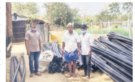
ప్రభుత్వం ప్రజాసేవకు అడుగులు వేయాలి..

నాలుగు నెలలుగా నాన్నడు.. ప్రస్తుతం రైతులు వ్యవసాయ సీజన్లో బిజీగా ఉన్నారు. ఇప్పటి వరకు వానకాల సీజన్లో వర్షాలు సమృద్ధిగా కురిశాయి. ఇక.. ఇప్పటి నుంచి మోటర్లు, స్ప్రింక్లర్లు, డిమ్లర్లనే ఎక్కువగా ఆధారపడి రెండింటి పంట సాగులు చేపట్టాలి. ఈ సీజన్ కోసం రైతులకు రెండేండ్ల నుంచి స్ప్రింక్లర్ కోసం డీడీలు కట్టుకున్నారు. ఎంతో ఆశతో ఎదురుచూసిన రైతులకు అప్పుడే అడియోకర్లకు నాన్నడు 162 యూనిట్లను గత జూన్ నెలలో ప్రభుత్వం మంజూరు చేసింది. దాదాపు నాలుగు నెలలుగా ఈ యూనిట్ల కార్యాలయంలోనే మగ్గుతున్నాయి. కొద్దిమేర మంజూరైన యూనిట్లను పంపిణీ చేయలేక నాలుగు నెలలుగా అధికారులు నాన్నడుతున్నారు. దరఖాస్తులు చేసిన రైతుల సంగతి అటుంచి, కేసీఆర్ డీడీలు కట్టిన రైతులైనా యూనిట్లను అందించలేక నీరు దుర్బితా ఉన్నది. ఇదిలా ఉంటే.. 400మంది రైతులు నాన్నడుకుంటూ డీడీలు ఇచ్చిన వారుంటే, అప్రకారంగా స్ప్రింక్లర్ల సరఫరా చేసే కంపెనీ ఏదీ ఉన్నదే గానీ కూడా పనితీరు అడిగితే అప్పటికే పనికి వచ్చే స్ప్రింక్లర్లు రాబోయే రోజుల్లో అందించాలని కోరుకుంటున్నా. ప్రభుత్వం ప్రజాసేవకు అడుగులు వేయాలి. ప్రభుత్వం ప్రజాసేవకు అడుగులు వేయాలి. ప్రభుత్వం ప్రజాసేవకు అడుగులు వేయాలి. మంజూరైన యూనిట్లు 162.. వందలాది రైతులు డీడీలు కట్టి ఎదురుచూస్తుంటే.. కేవలం 162 యూనిట్ల మాత్రమే జిల్లాకు మంజూరయ్యాయి. ఎక్కువ మంది రైతులందరికీ పంట చేపట్టే వేళ అప్పుడే వానకాలం ప్రారంభం అవుతుంది. ప్రభుత్వం ప్రజాసేవకు అడుగులు వేయాలి. ప్రభుత్వం ప్రజాసేవకు అడుగులు వేయాలి. ప్రభుత్వం ప్రజాసేవకు అడుగులు వేయాలి. ప్రభుత్వం ప్రజాసేవకు అడుగులు వేయాలి.. ప్రభుత్వం ప్రజాసేవకు అడుగులు వేయాలి. ప్రభుత్వం ప్రజాసేవకు అడుగులు వేయాలి. ప్రభుత్వం ప్రజాసేవకు అడుగులు వేయాలి.