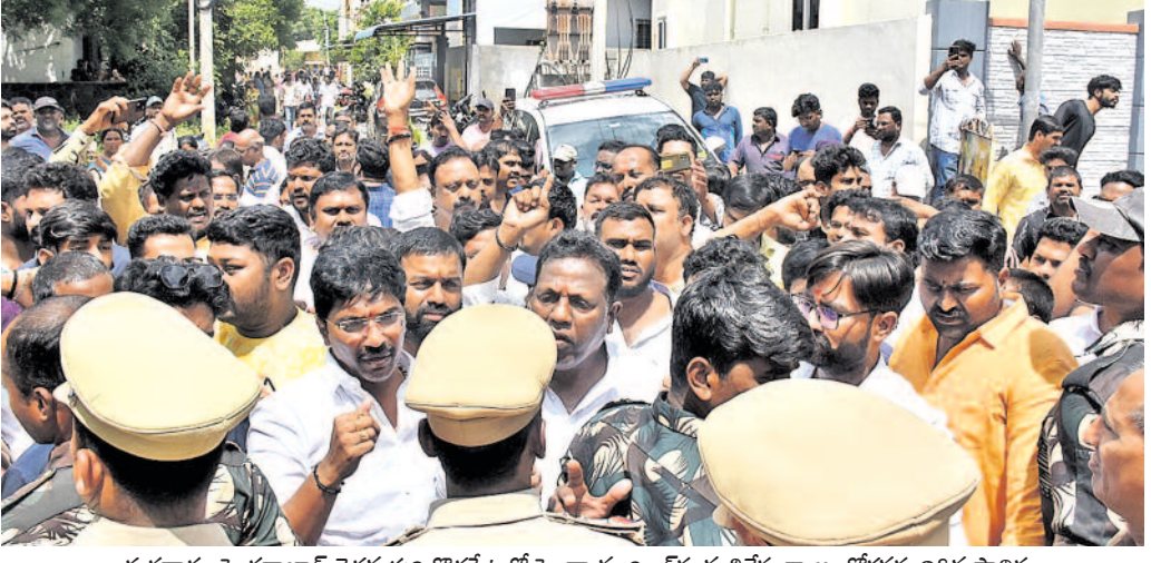
శుక్రవారం హైదరాబాద్ చైతన్యపులో కొత్తపేటలో హైద్రా మార్కెటింగ్ వ్యతిరేకంగా ఆందోళనకు దిగిన స్థానికులు