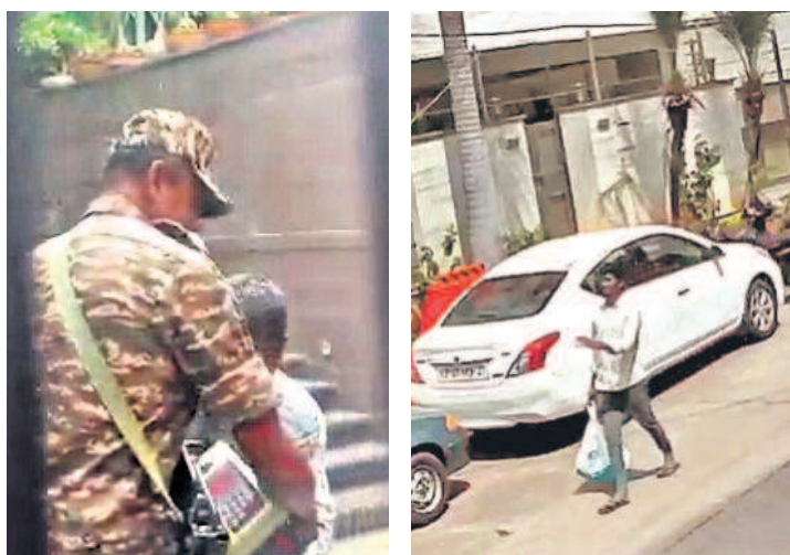
జూబిహిల్స్ లో రోడ్ నం 17లోని పాంగులేటి నివాసంలో సోదాల సమయంలో పోలీసు లెక్కలు మిగిలిన తీసుకువచ్చిన ఈడీ సిబ్బంది

పాంగులేటి వ్యవహారాలకు సంబంధించిన కీలక పత్రాలు ఈ సోదాల్లో ఈడీకి హస్తగతమైనట్లు విశ్వసనీయ సమాచారం. తెలంగాణలో వివక్ష పాత్రలకు చెందిన పలువురు ఎమ్మెల్యేలను ఇటీవలే కాంగ్రెస్ లో చేర్చుకోవడం వెనుక మంత్రి పాంగులేటి తీవ్ర నివాస రెడ్డి కీలక పాత్ర పోషించారు.